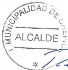
REBECA COFRÉ CALDERON ALCALDESA

Si una institución u organización, no efectúe las acciones comprometidas en el proyecto propuesto, deberá hacer devolución de los montos otorgados, si no lo hiciera, la Municipalidad a través de la Asesoría Jurídica, podrá adoptar las acciones judiciales pertinentes para recuperar los recursos otorgados. De igual forma, si toma conocimiento de algún ilícito, deberá presentar los antecedentes al Ministerio Público, entidad responsable de la persecución penal en el país.