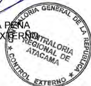
ESTEBAN MIRANDA PEÑA JEFE DE CONTROL EXTERNO