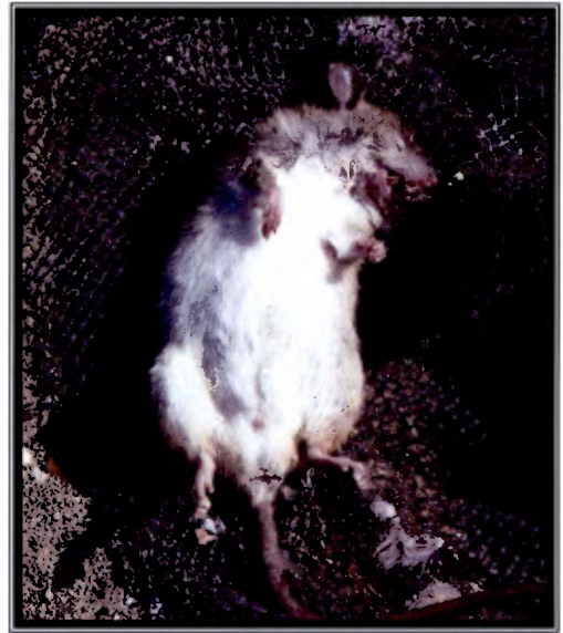
Fotos 21 y 22. Moscas, arañas y roedor muerto