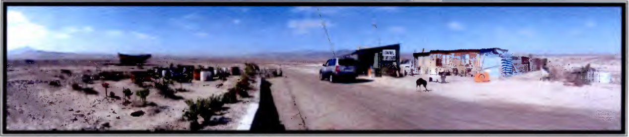
Foto 1: El control del recinto, terreno no tiene cerco perimetral