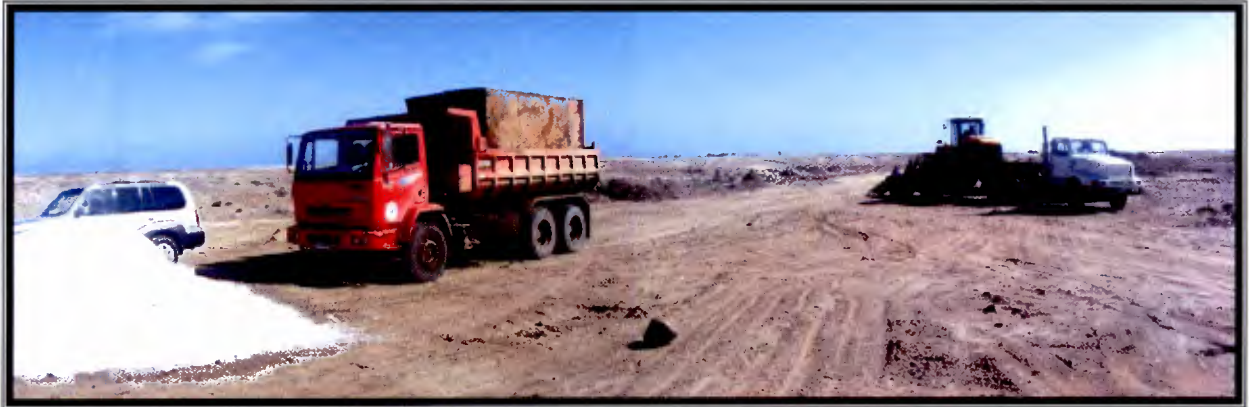
Foto 14: camiones de la Dirección de Vialidad preparando mezcla de bischofita