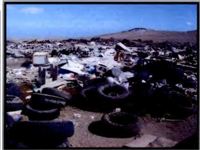
Fotos 4 y 5: Residuos sólidos y orgánicos correspondientes a desechos de empresas