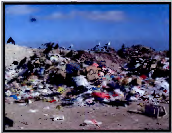
Fotos 8, 9 y 10: No existe orden, sectorización ni clasificación de residuos