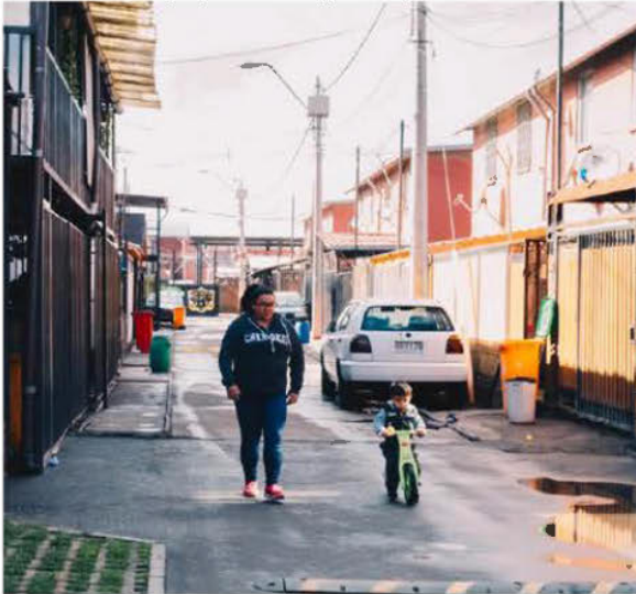
Villa Jardines de Velásquez, caso estudio Región Metropolitana.