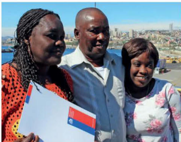
Folleto para migrantes con información para postular a programas Minvu, 2017