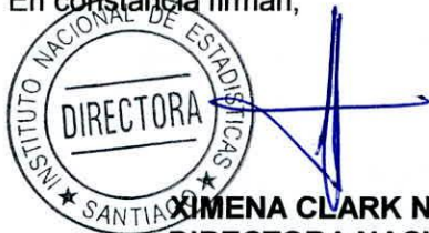
XIMENA CLARK NÚÑEZ DIRECTORA NACIONAL INSTITUTO NACIONAL DE ESTADÍSTICAS