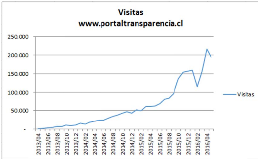
Figura 20. Gráfico de visitas mensuales al portal de transparencia

El promedio mensual de visitas al Portal de Transparencia en los últimos 3 meses es de 190.778 visitas, cifra que está vinculada con el grado de conocimiento y uso del Portal en internet.