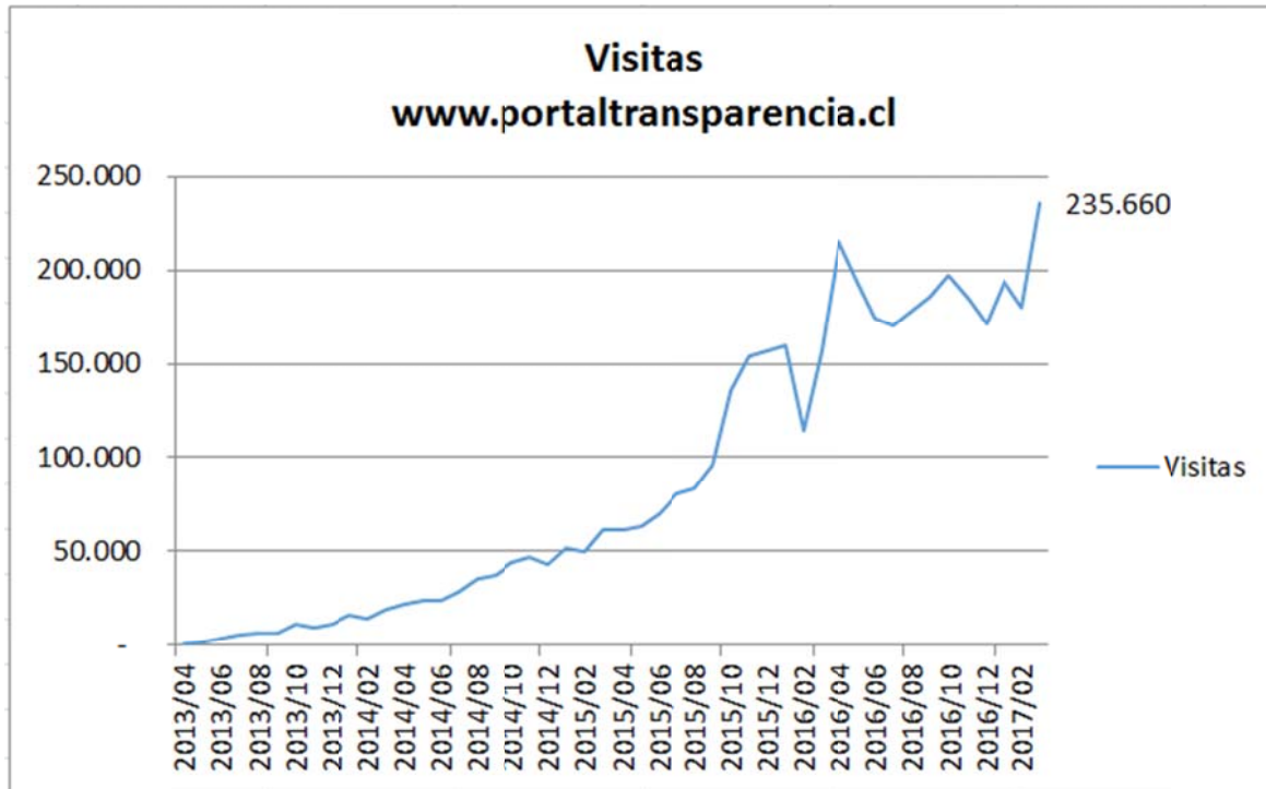
Figura 20. Gráfico de visitas mensuales al portal de transparencia

El promedio mensual de visitas al Portal de Transparencia en los últimos 3 meses es de 203366 visitas, cifra que está vinculada con el grado de conocimiento y uso del Portal en internet.