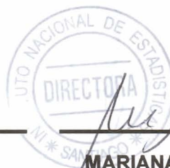
MARIANA SCHKOLNIK CHAMUDES Directora Nacional INSTITUTO NACIONAL DE ESTADISTICA