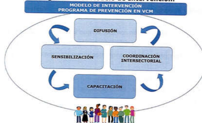
Diagrama N°5: Modelo de Intervención.

Personas mayores de 14 años, de ambos sexos.