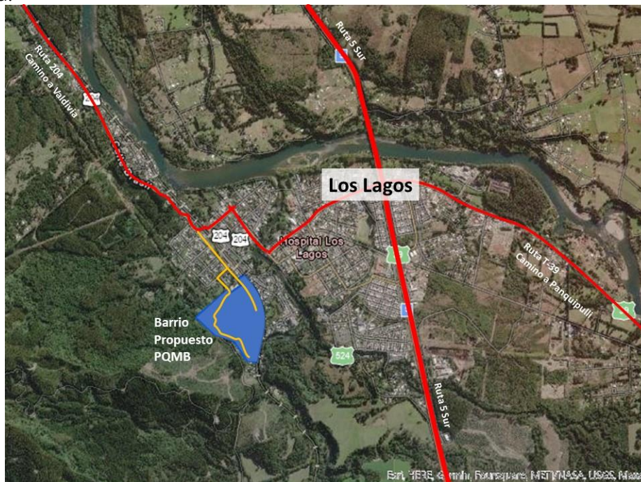
IMAGEN 1.- ELABORACIÓN PROPIA. SECPLAN 2022

El Plan Maestro posee ejes transversales que son Identidad, Seguridad y Medioambiente, entre otros, los que son determinantes para el desarrollo de una intervención integradora. Mediante el llamado indicado en la Resolución Exenta N° 01061 de fecha 25 de agosto del año 2022, del MINVU, la I. Municipalidad de Los Lagos tiene bien informar al presente Consejo Municipal que participará de ella con la postulación del “Barrio Humedal Collilelfu” , el cual comprende las poblaciones El Bosque, Villa Collilelfu, Los Encinos y Villa Fe y Esperanza.