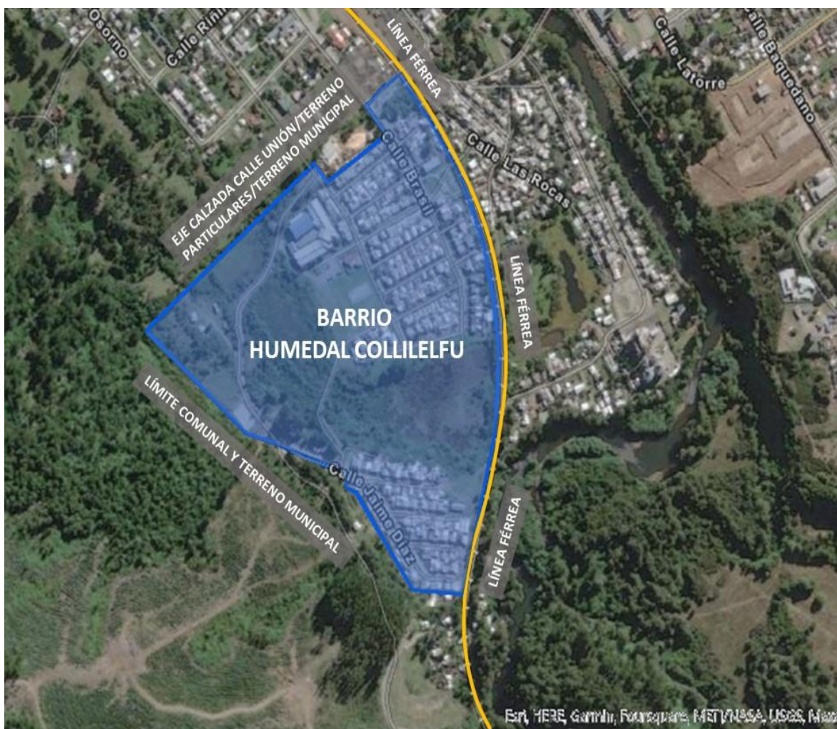
IMAGEN 2.- POLÍGONO PROPUESTO. ELABORACIÓN PROPIA. SECPLAN 2022

Ante estos requerimientos y las características social-urbana, se propone el polígono “Barrio Humedal Collilelfu” ya que cumple todos los requerimientos presentes para la postulación, teniendo equipamientos y áreas verdes en mal estado de conservación junto con una falta de consolidación de ellas, además de estar rodeado por el Humedal Collilelfu el que entrega características únicas al barrio dentro de la ciudad de Los Lagos, en cuanto a la preservación de un ecosistema con procesos hidrológicos y ecológicos, por la diversidad de flora y fauna que sustenta.