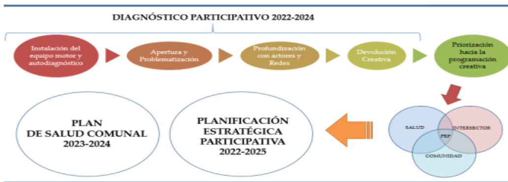
Imagen 1: Propuesta metodológica y principales hitos participativos del Departamento de Salud para el año 2022.