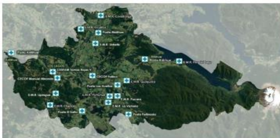
Imagen 1: Red de atención primaria comuna de Los Lagos.

Además, como dependencias de salud se cuenta en el territorio urbano con un Gimnasio de la Salud, un Centro de Atención Integral Infanto-Juvenil, en donde se realizan las prestaciones del Programa Espacio Amigable y parte de la Sala de Estimulación, adosado al Departamento de Educación Municipal, un Centro del Adulto Mayor en donde realizan actividades y prestaciones el Programa Más Adultos Mayores Autovalentes, Podólogo y Kinesiólogo, una Unidad de Atención Primaria Oftalmológica (UAPO) y el Centro Comunitario de Rehabilitación adosado al CECOSF Manuel Miranda.