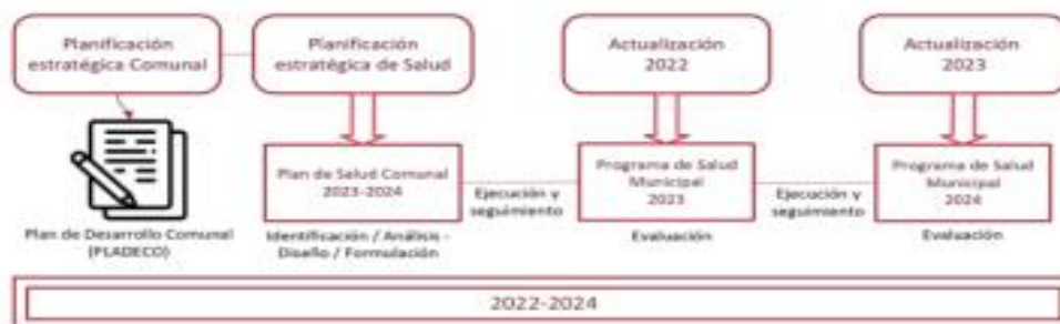
Figura 3: Planificación para el periodo 2023-2024. Fuente: MINSAL 202

Orientaciones para la planificación y programación en red año 2023: proveniente de la Subsecretaría de Redes Asistenciales de MINSAL, define los énfasis en estrategias, acciones y grupos de población a considerar en los procesos de planificación local en salud. En relación al Plan de Salud Comunal (PSC), de acuerdo con el artículo 38 de la Ley N°19.378 es de responsabilidad de cada entidad administradora de salud municipal y debe enmarcarse en las normas técnicas y del modelo de atención definido por el Ministerio de Salud 54 . Dicho plan debe guiar el accionar comunal en los temas de salud, respondiendo a las características de salud propias de la población perteneciente a su territorio. El PSC debe ser formulado a través de una planificación estratégica y debe tener una visión de mediano plazo, es decir, debe formularse, a lo menos, para todo un período alcaldicio y tener ajustes anuales en caso de ser necesario. La comuna debe procurar la participación de los funcionarios y funcionarias que conforman los equipos de salud y de los sectores de la comunidad que contribuyan a los objetivos sanitarios del territorio (figura 3).