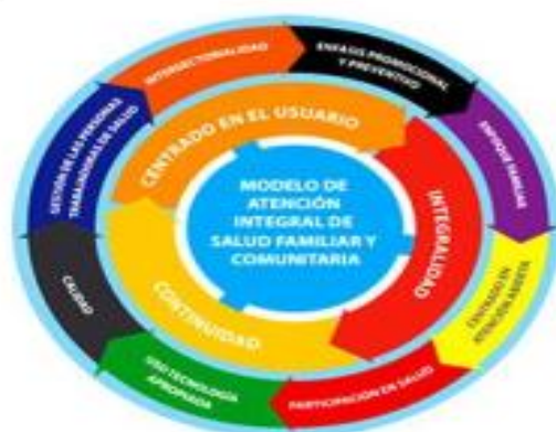
Figura 2: Modelo de atención integral de salud familiar y comunitaria.

Modelo de Atención Integral en Salud con enfoque familiar y comunitario: El proceso de planificación y programación de la red se enmarca en el modelo de atención integral de salud familiar y comunitaria, el cual ha sido definido como "para un territorio, en el que se pone a las personas en el centro de la toma de decisión, se les reconoce como integrantes de un sistema sociocultural diverso y complejo, donde sus miembros son activos en el cuidado de su salud y el sistema de salud se organiza en función de las necesidades de los usuarios, orientándose a buscar el mejor estado de bienestar posible, a través de una atención de salud integral, oportuna, de alta calidad y resolutive, en toda la red de prestadores, la que además es social y culturalmente aceptada por la población, ya que considera las preferencias de las personas, la participación social en todo su quehacer - incluido el intersector - y la existencia de sistemas de salud indígena (figura 2)