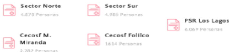
Imagen 2: Distribución de usuarios/es inscritos en la Comuna de Los Lagos.

El Departamento de Salud Municipal funciona en un edificio aparte del CESFAM desde el año 2022, lugar en donde igualmente se desarrolla la toma de muestra de exámenes en conjunto a un convenio de colaboración con el Hospital de Los Lagos.