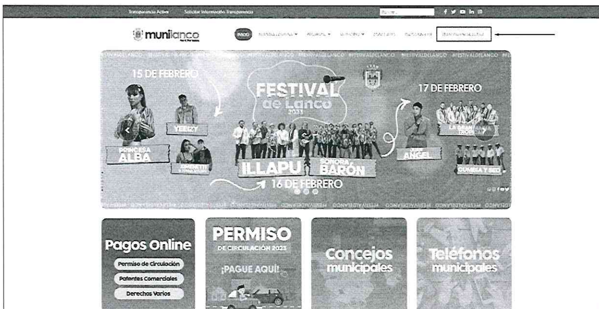
Banner de Transparencia: Operativo