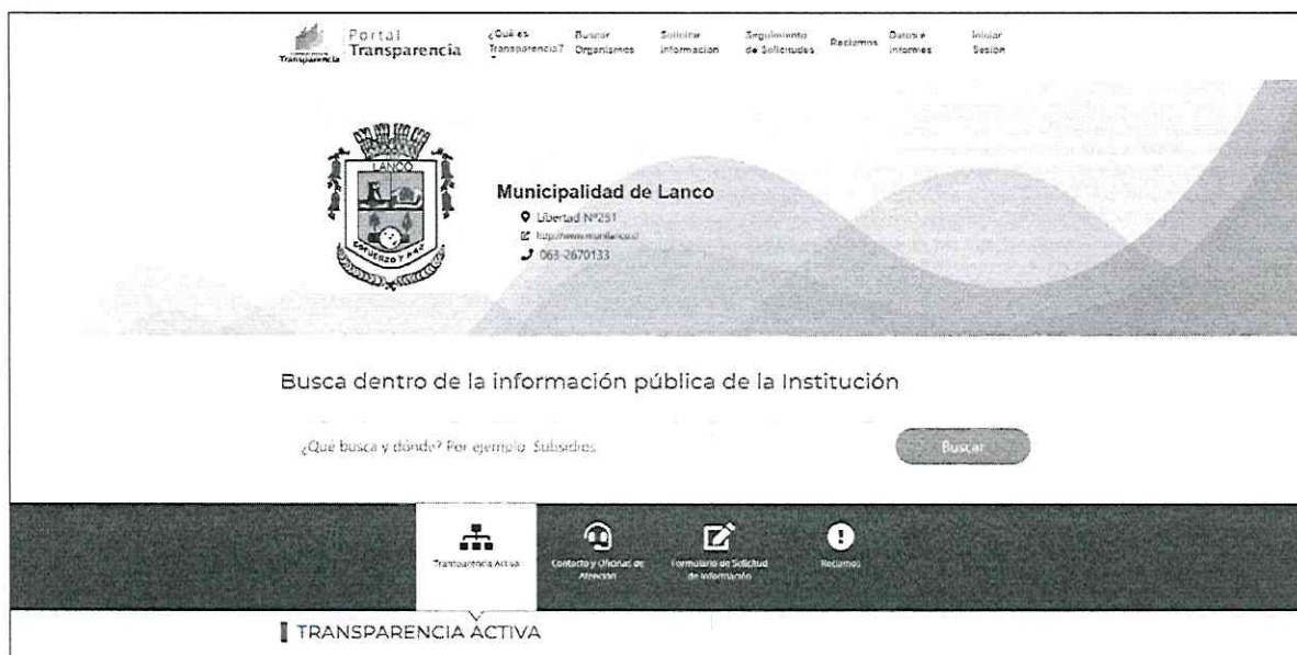
Redirección de Banner Transparencia Activa: Operativo