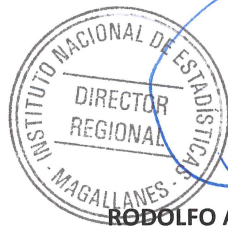
RODOLFO ARECHETA BUCAREY Director Regional Instituto Nacional de Estadísticas

ANÓTESE, REFRÉNDESE Y ARCHÍVESE POR ORDEN DE LA DIRECTORA NACIONAL DE ESTADÍSTICAS