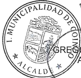
GREGORIO VALENZUELA ABARCA ALCALDE DE COINCO