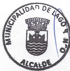
MIGUEL ÁNGEL MEZA SHWENKE ALCALDE ILUSTRE MUNICIPALIDAD DE LAGO RANCO