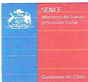
tabla N° 1 o al cumplimiento del 60% de ejecución financiera de los recursos de la primera cuota, los que deberán ser rendidos de acuerdo a la Resolución N°30, del año 2015, sobre “Rendiciones de Cuentas”, de la Contraloría General de la República, y a las instrucciones y formatos impartidos por SENCE para tales efectos. El requisito de no tener rendiciones y/o reintegros pendientes, en cualquier Programa del SENCE, aplica también para la transferencia de esta segunda cuota.

En el caso que la OMIL no cumpla los requisitos para la transferencia de la segunda cuota, la Dirección Regional deberá comunicar la situación al Alcalde a través de Oficio, con el objetivo de informarle del incumplimiento y solicitarle la adopción de medidas correctivas.