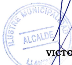
VICTOR ANGULO MUÑOZ Alcalde Municipalidad de Llanquihue