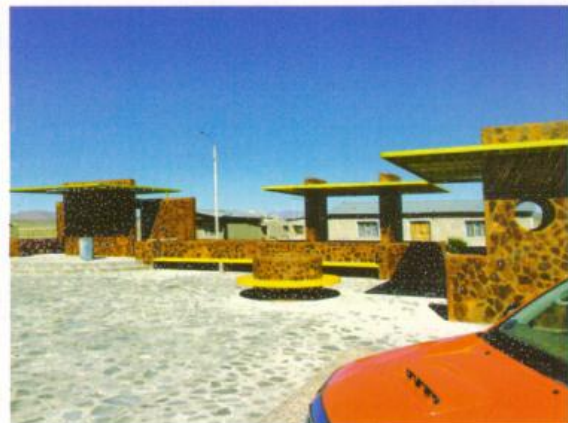
Construcción Plaza Pública de Piñga Carpa Piñga Carpa $ 125.300.000.-