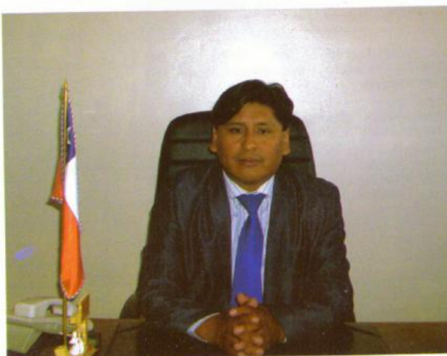
Teófilo Mamani García, alcalde de la comuna de Colchane