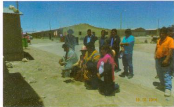
Construcción Pavimentos Calle Nº 1, 2, 3 y 4 de Piñga Carpa Piñga Carpa $ 68.657.575