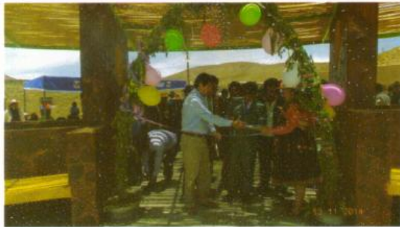
Construcción Plaza Pública de Ancovinto Ancovinto $ 78.076.268