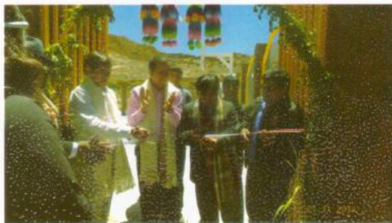
Construcción Multicancha de Huaytane Huaytane $ 79.974.226