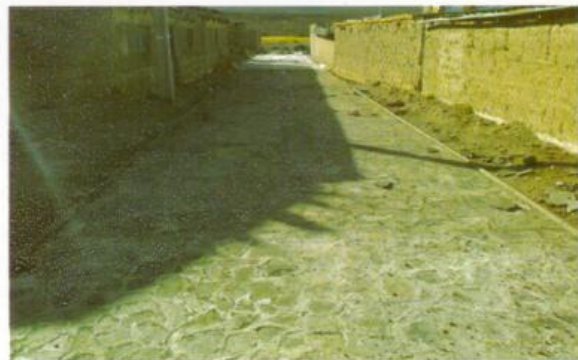
Construcción Pavimentos Calle Nº 1 de Cotasaya Cotasaya $ 77.762.520