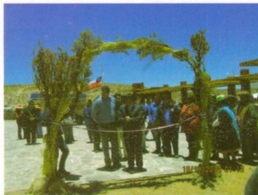
Construcción Plaza Pública de Ancasque Ancasque $ 78.317.294