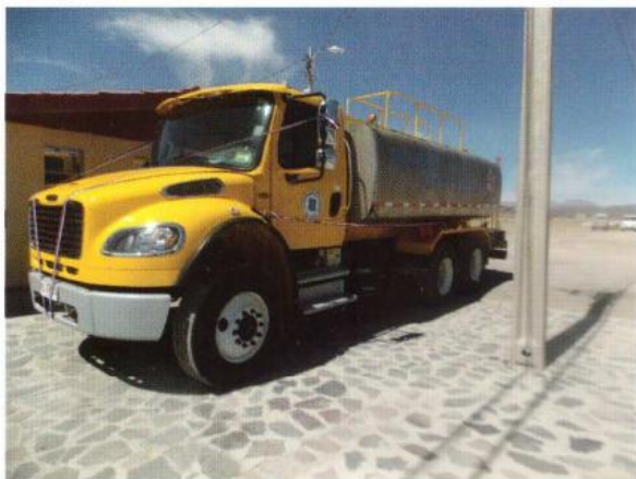
ADQUISICIÓN DE CAMIÓN ALJIBES PARA LA MUNICIPALIDAD DE COLCHANE