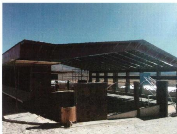
CONSTRUCCIÓN TECHUMBRE MULTICANCHA DE COTASAYA