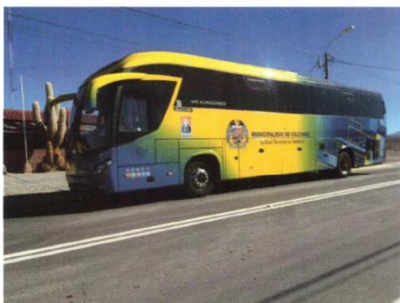
ADQUISICIÓN BUS DE PASAJEROS PARA LA MUNICIPALIDAD DE COLCHANE