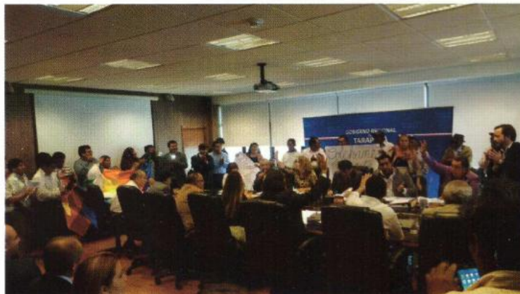
APROBACION DE $ 5.337.909.000.- PROYECTO ELECTRICO PACHICA COLCHANE

Durante el año 2015 se realizaron los Estudios y Proyectos para la presentación del nuevo diseño de Eléctrico entre Pachica y Colchane, lo cual permitió la obtención del financiamiento para la ejecución del proyecto, obra que tiene un costo superior a los $ 5.300.000.000.-