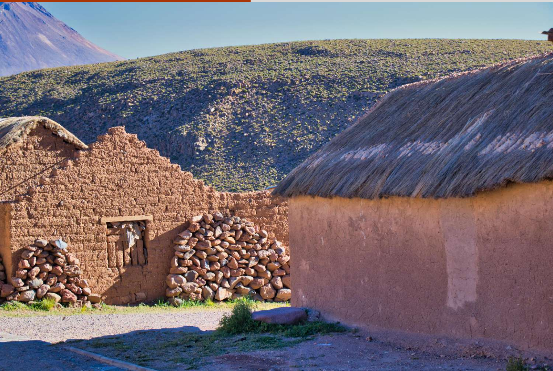
Viviendas construida en adobe y paja, Chulluncane.