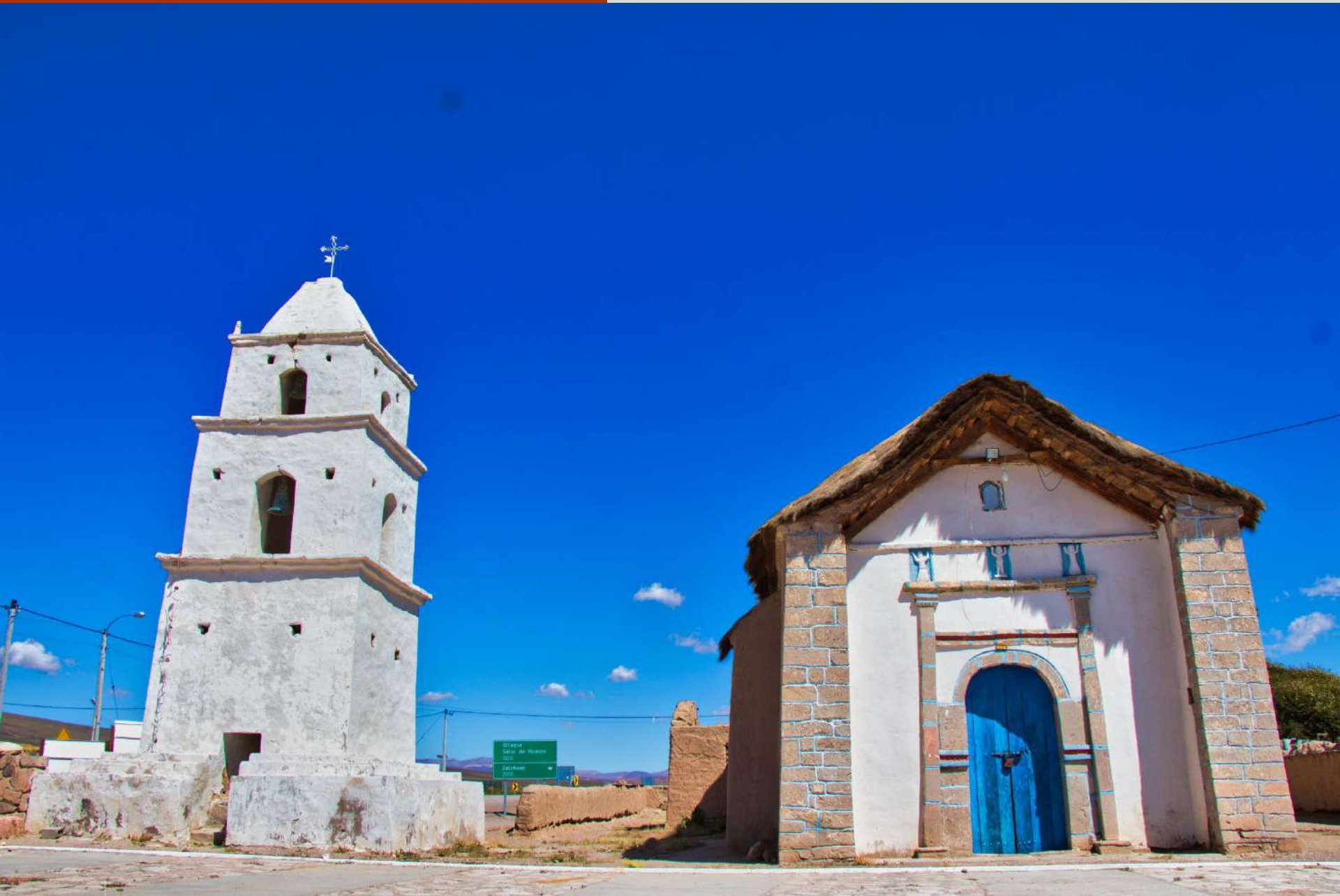
Iglesia de Cariquima, Monumento Histórico Nacional.