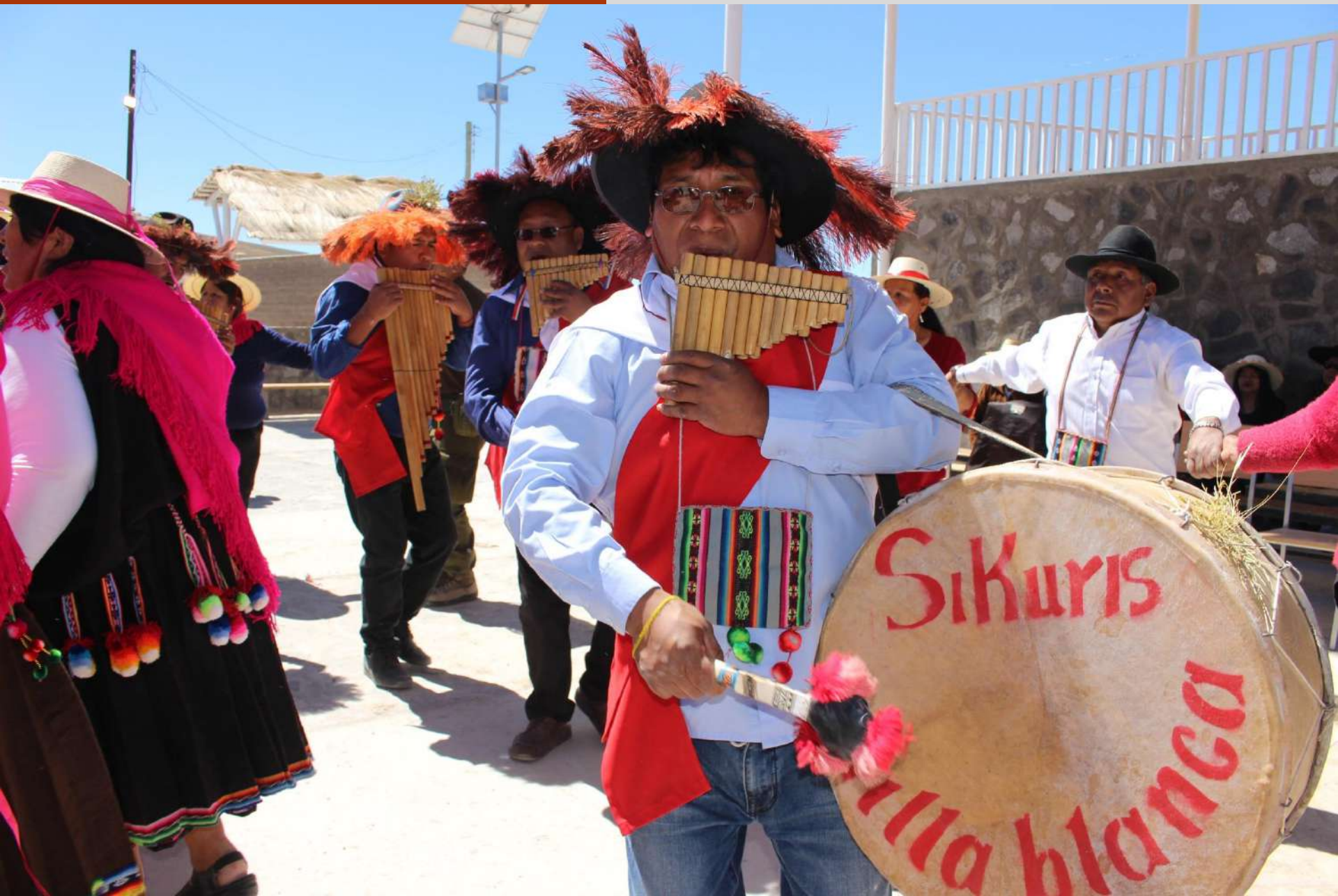
Sikuris de Villablanca, inauguración Sede Social de Villablanca.