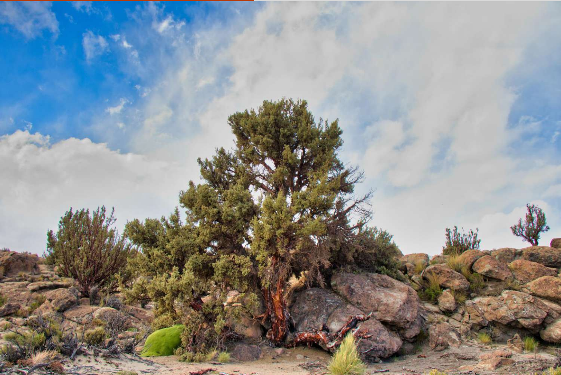
Árbol de Queñoa, sector Cariquima.