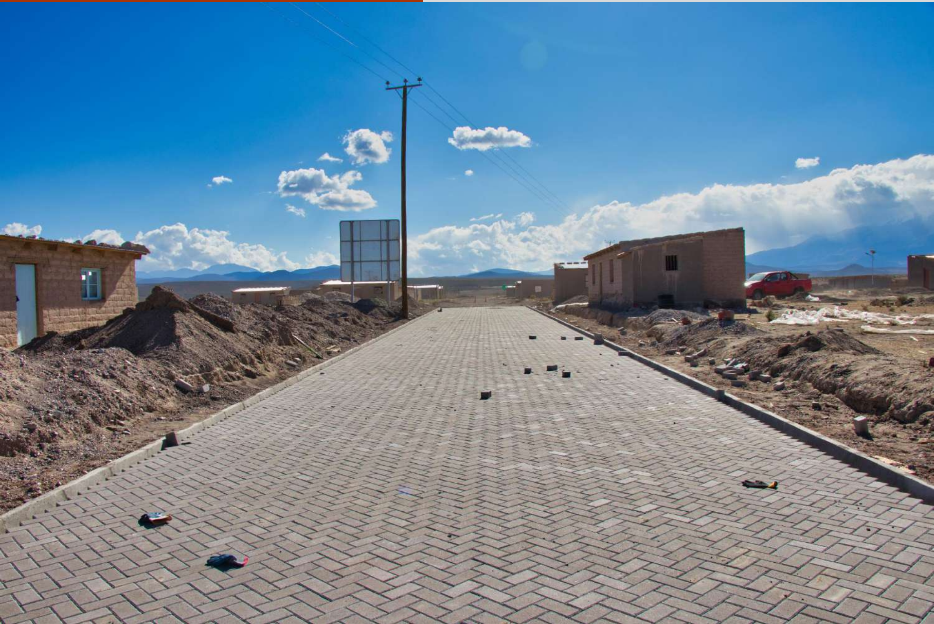
Pavimentación Participativa 28° Llamado, Escapiña.