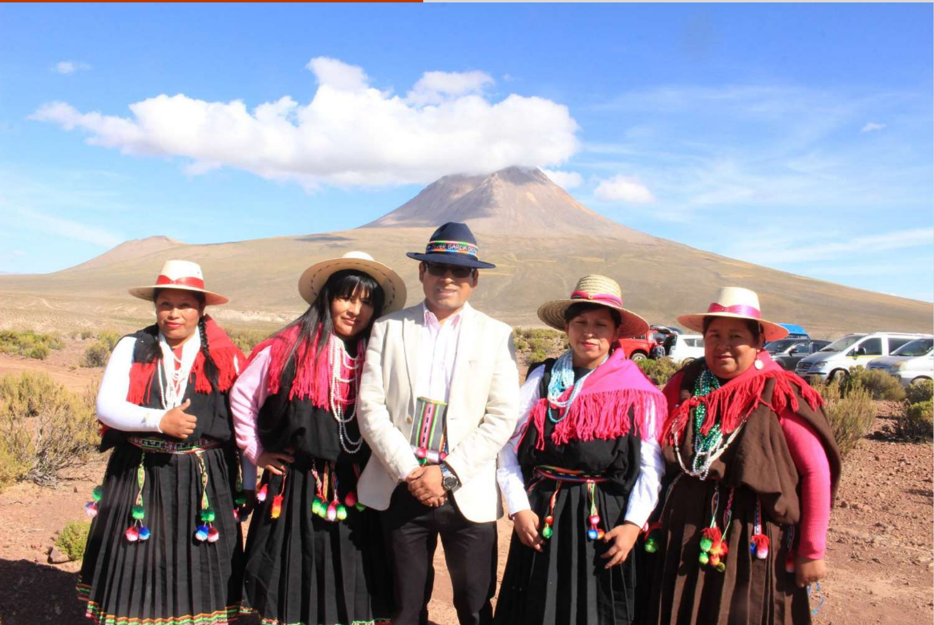
Muestra cultural de artes y costumbres aymara, Villablanca 2019.