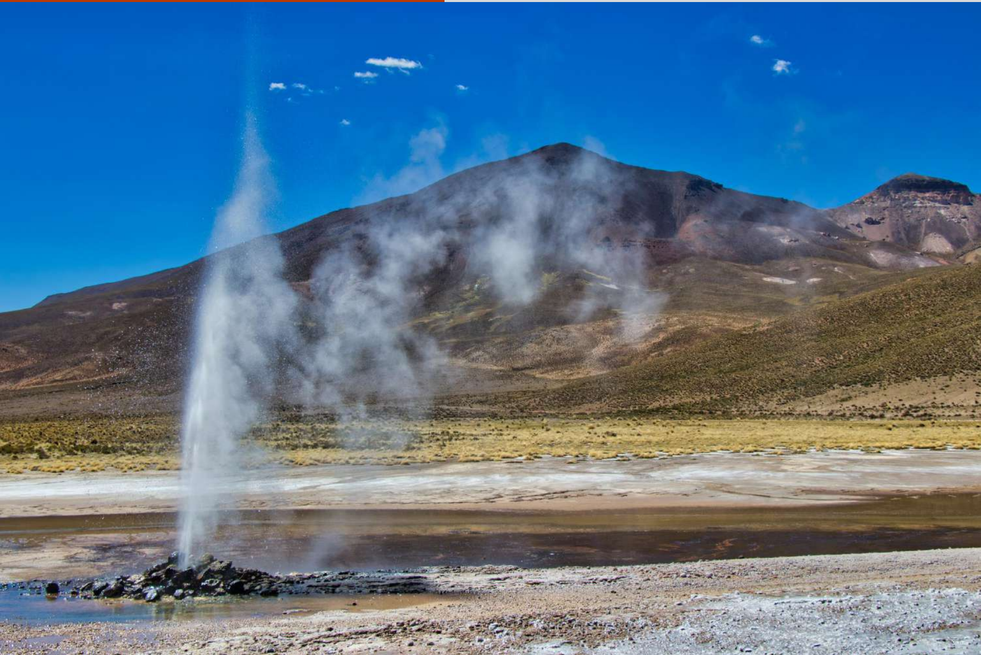
Géiser de Puchuldiza.