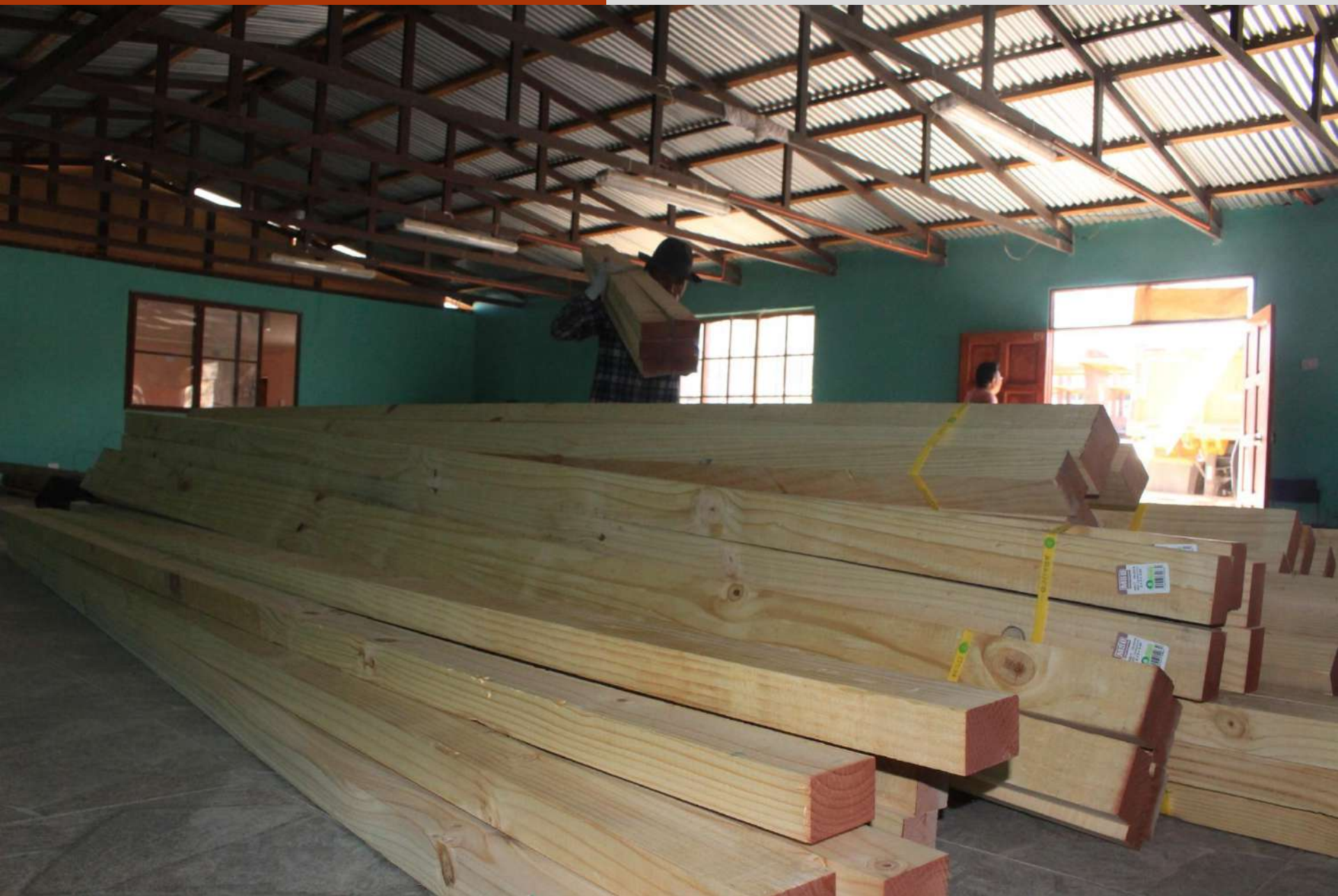
Proyecto comunitario Mejoramiento Termas Euquere, Ancuaque.