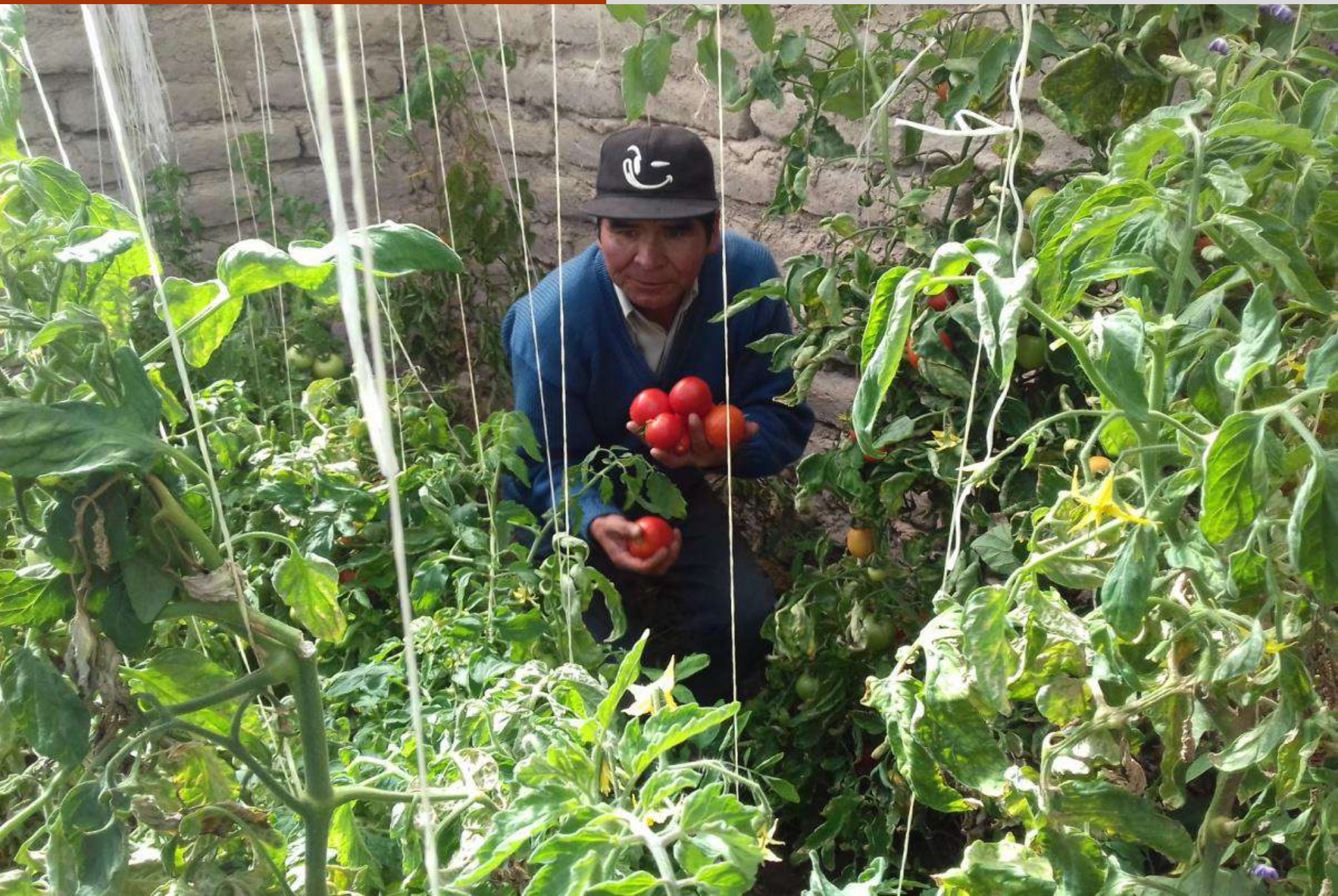
Cultivos de hortalizas y frutales en invernaderos de adobe.