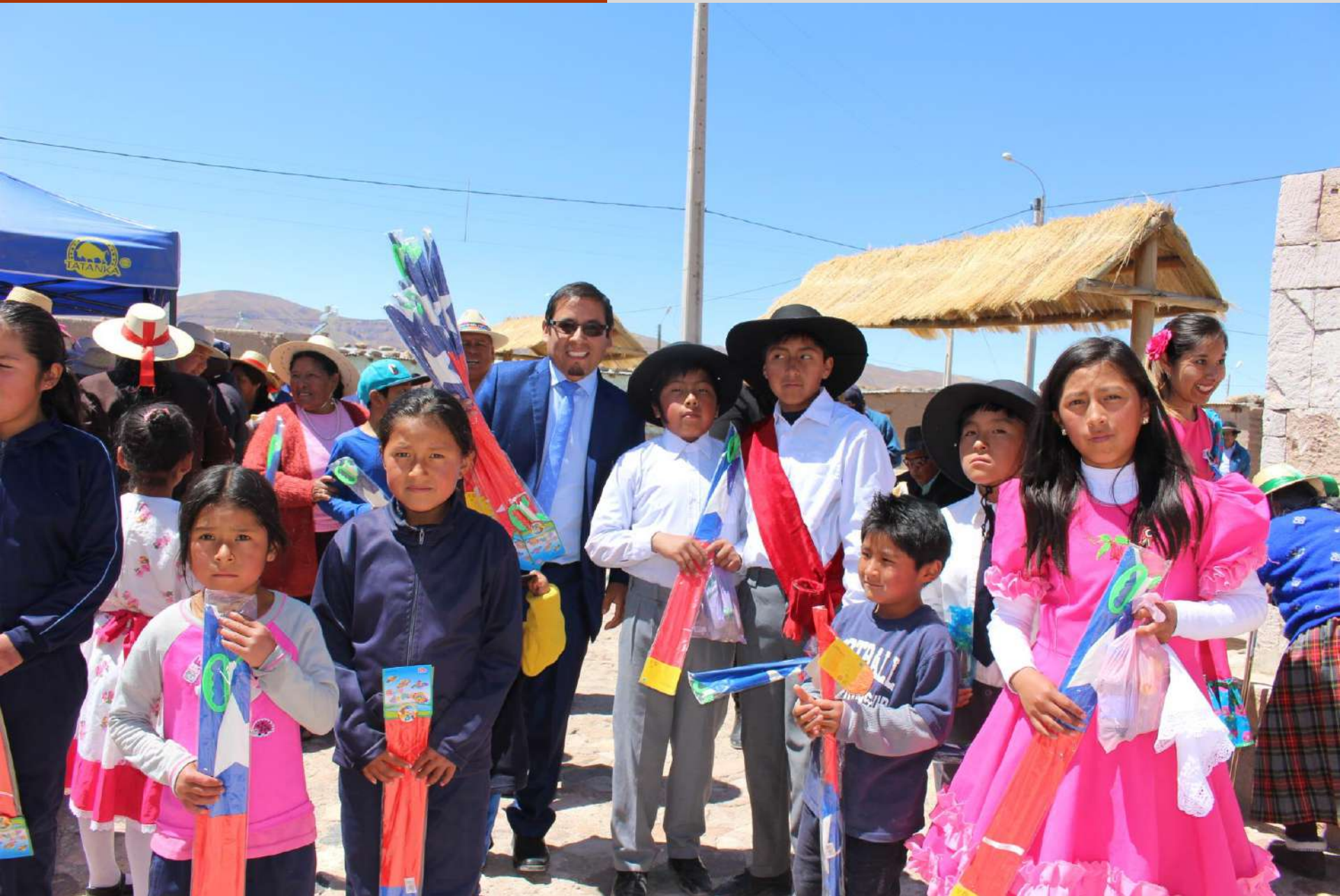
Celebración de Fiestas Patrias en Cariquima 2019.