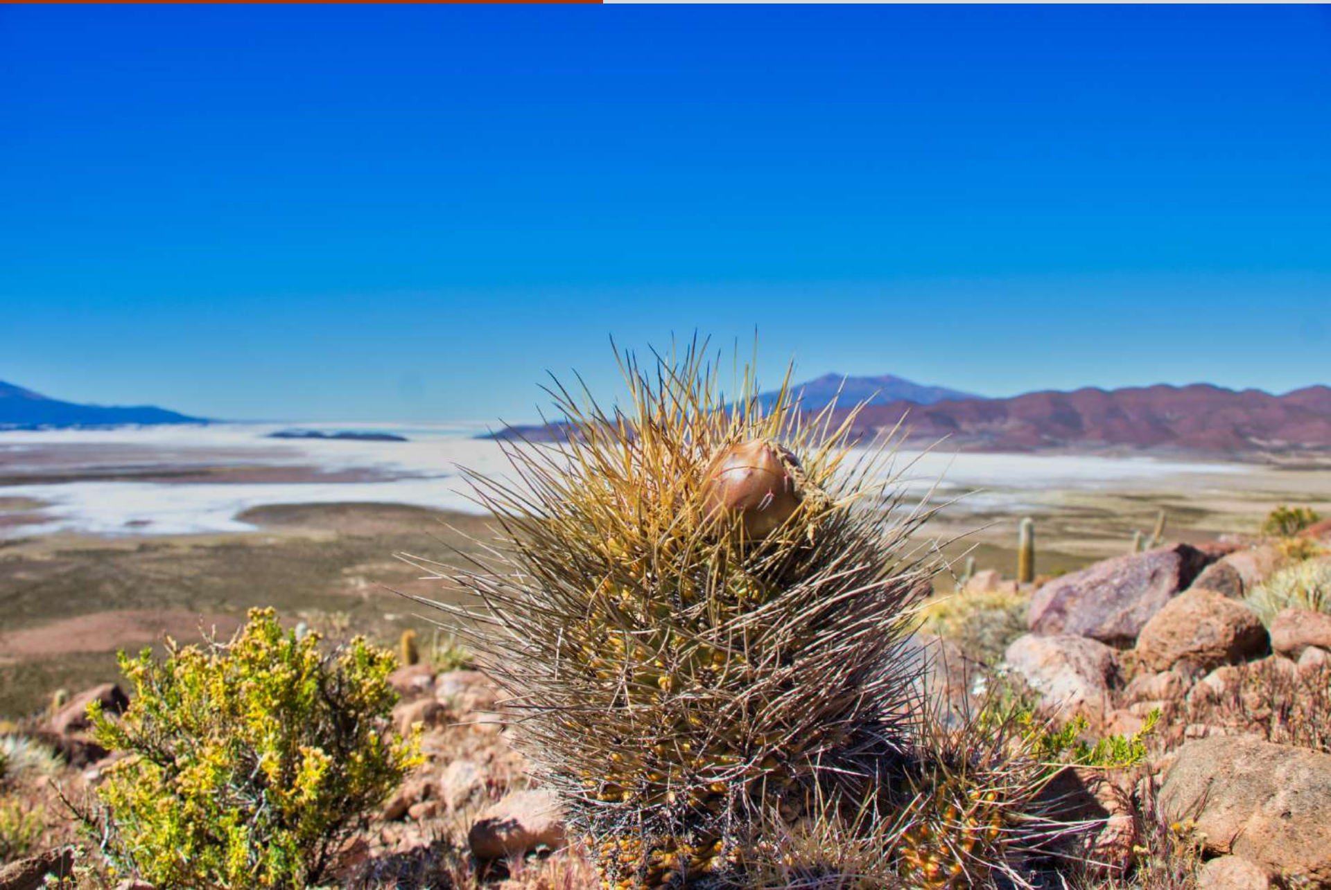
Cactus de Sank'abe, Bosque de Cactus de Thyuma.