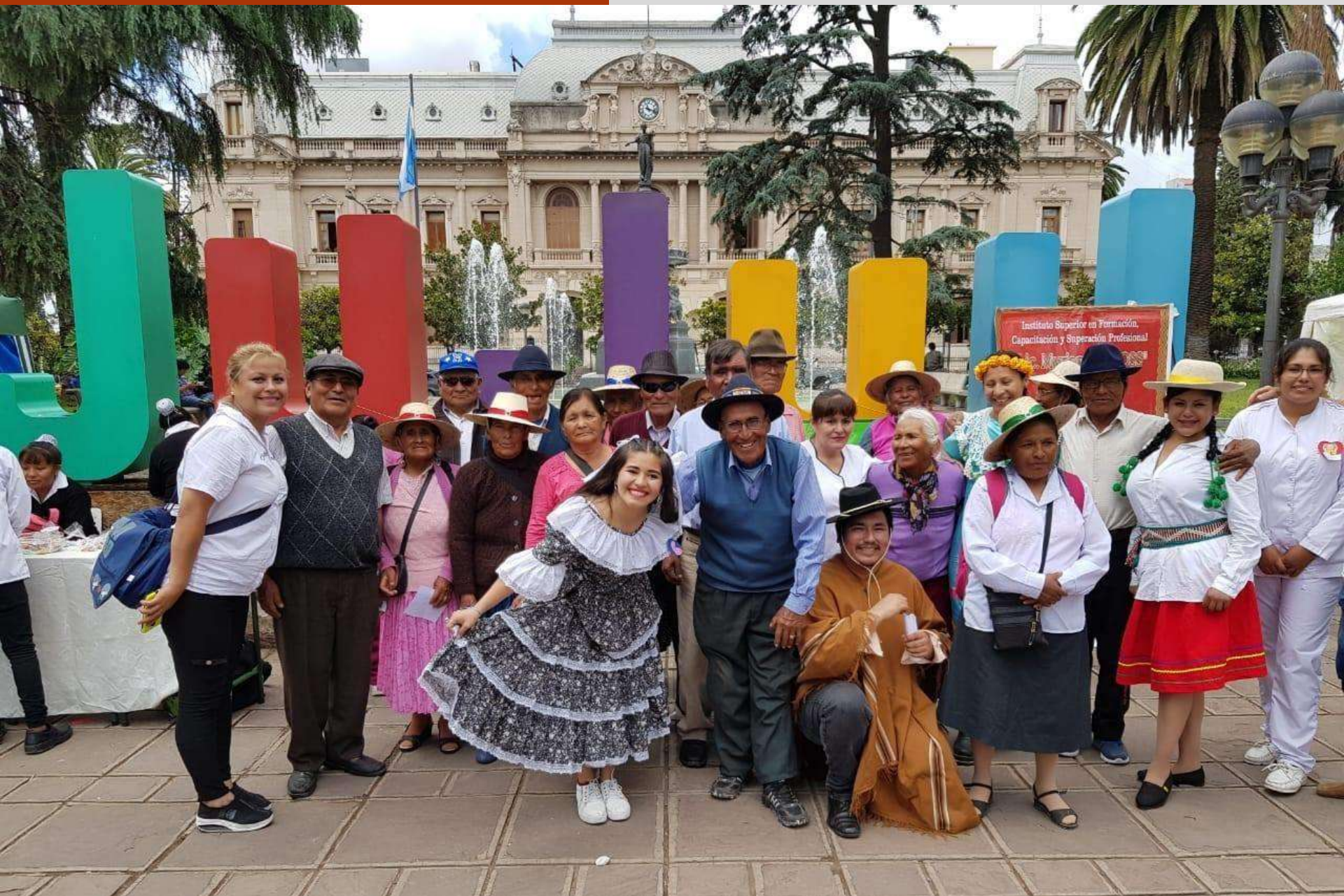
Viaje a Jujuy, Argentina, Programa para el Adulto Mayor.