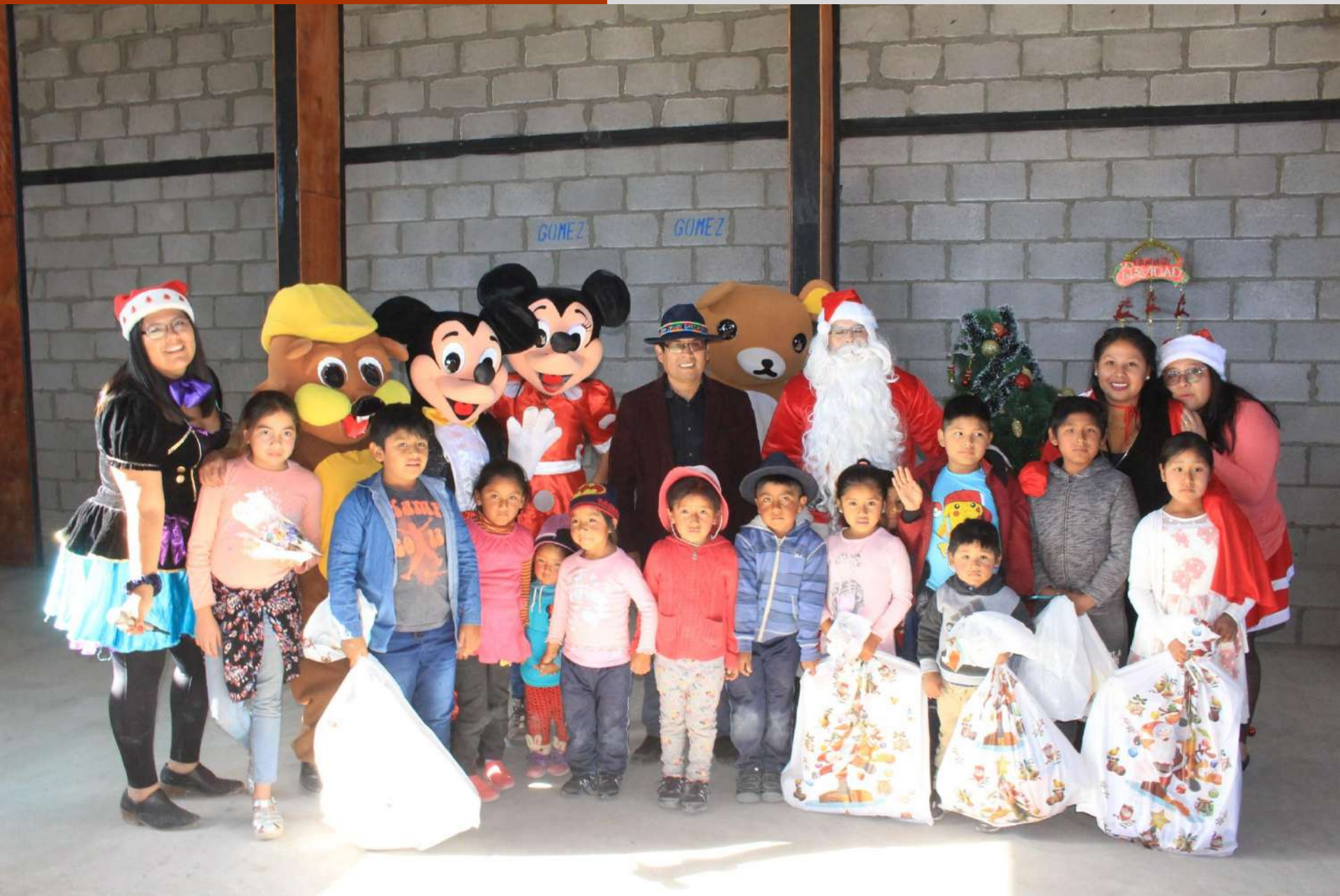
Celebración de Navidad en Enquelga 2019.