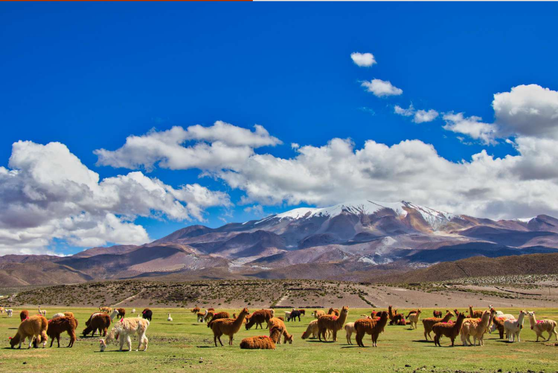
Tropa de Alpacas, Bofedal de Enquelga.