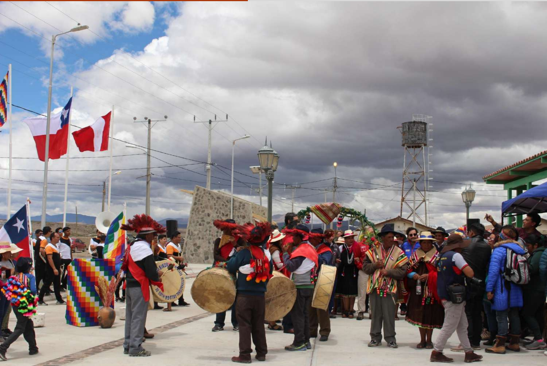
Inauguración Expo Colchane 2019.