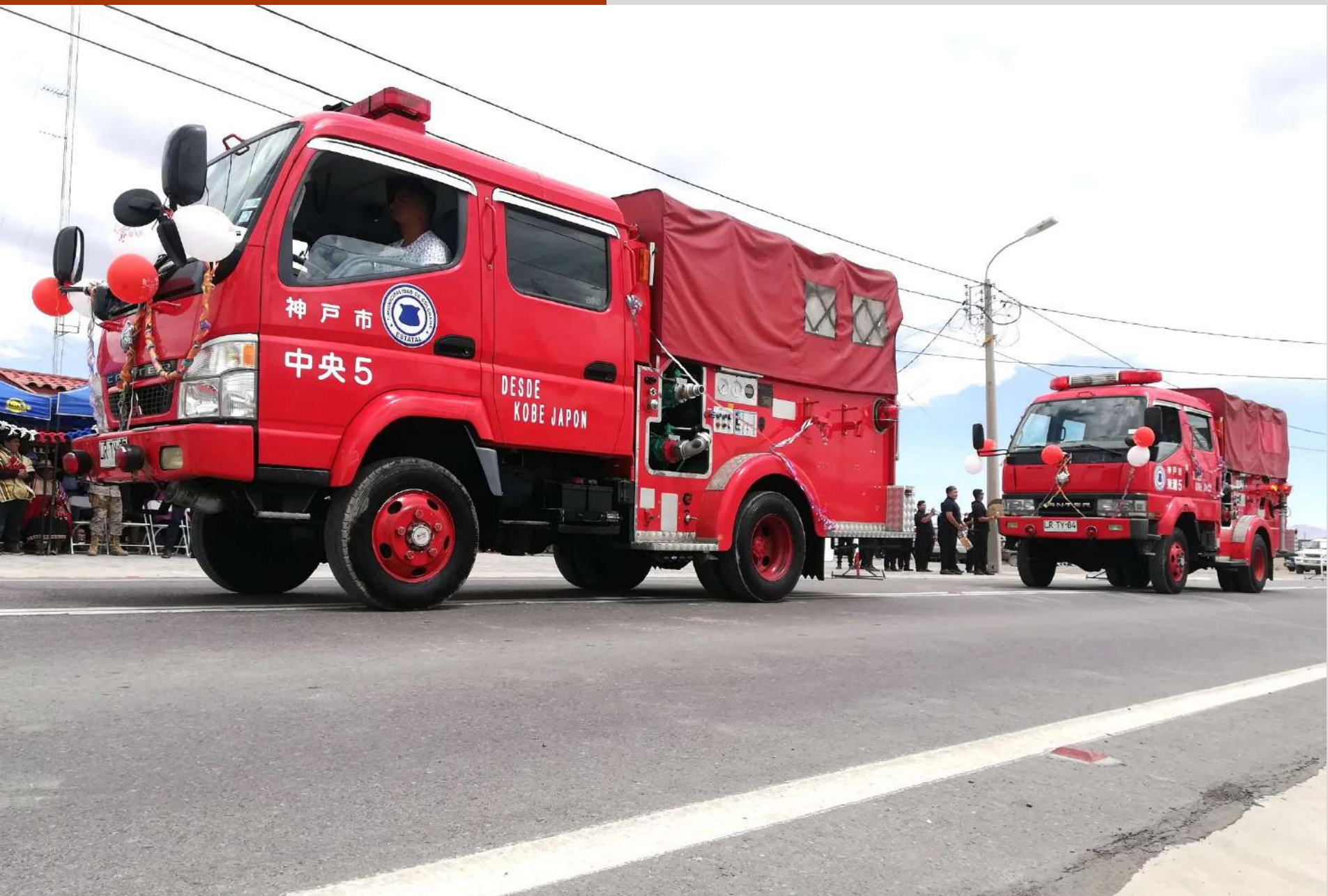
Inauguración Carros Bomba tramitados desde Kobe Japón.