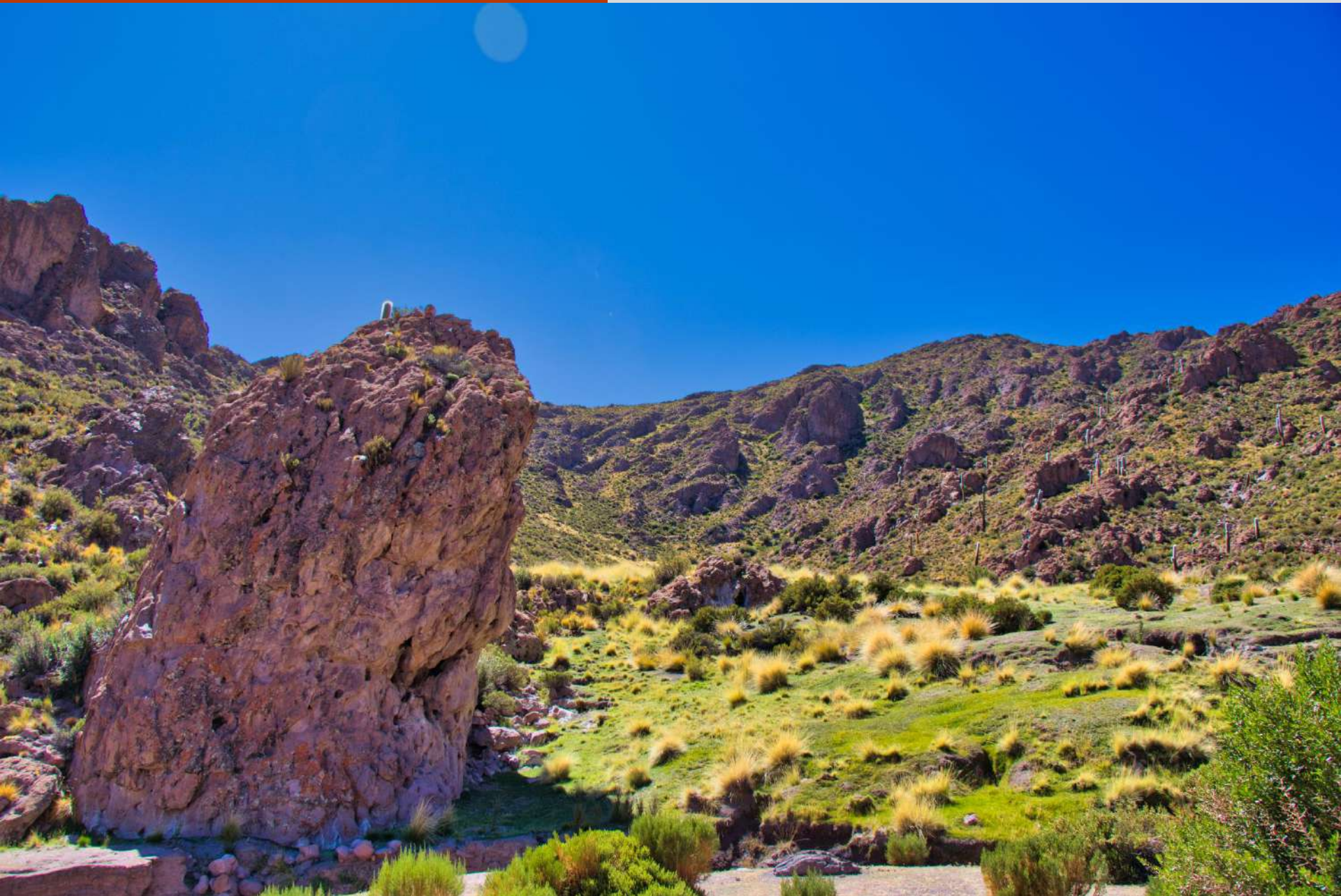
Sector de Kariwuany.