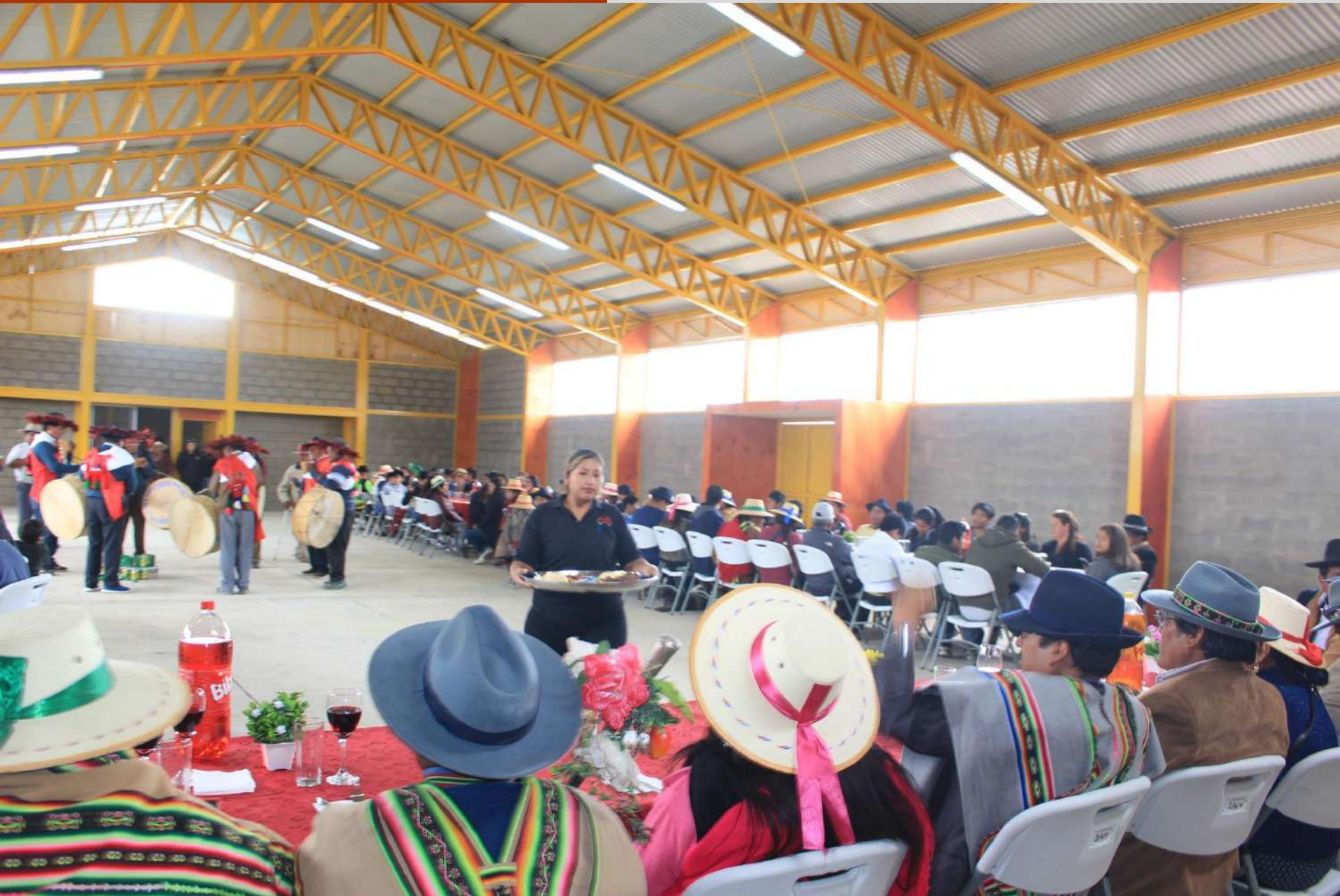
Inauguración Sala Multiuso de Escapiña.