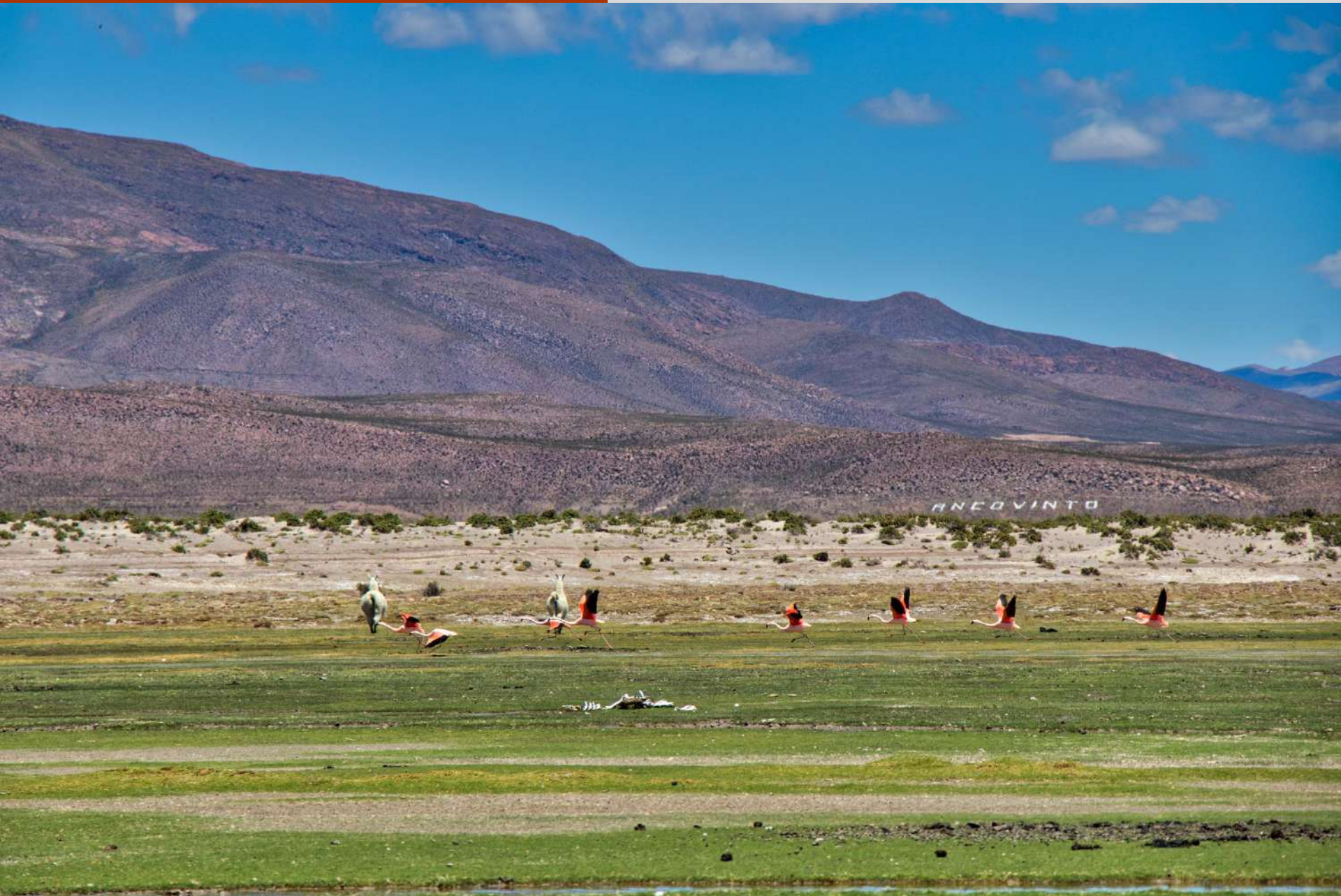
Vuelo de Flamencos, Sector de Ancovinto.