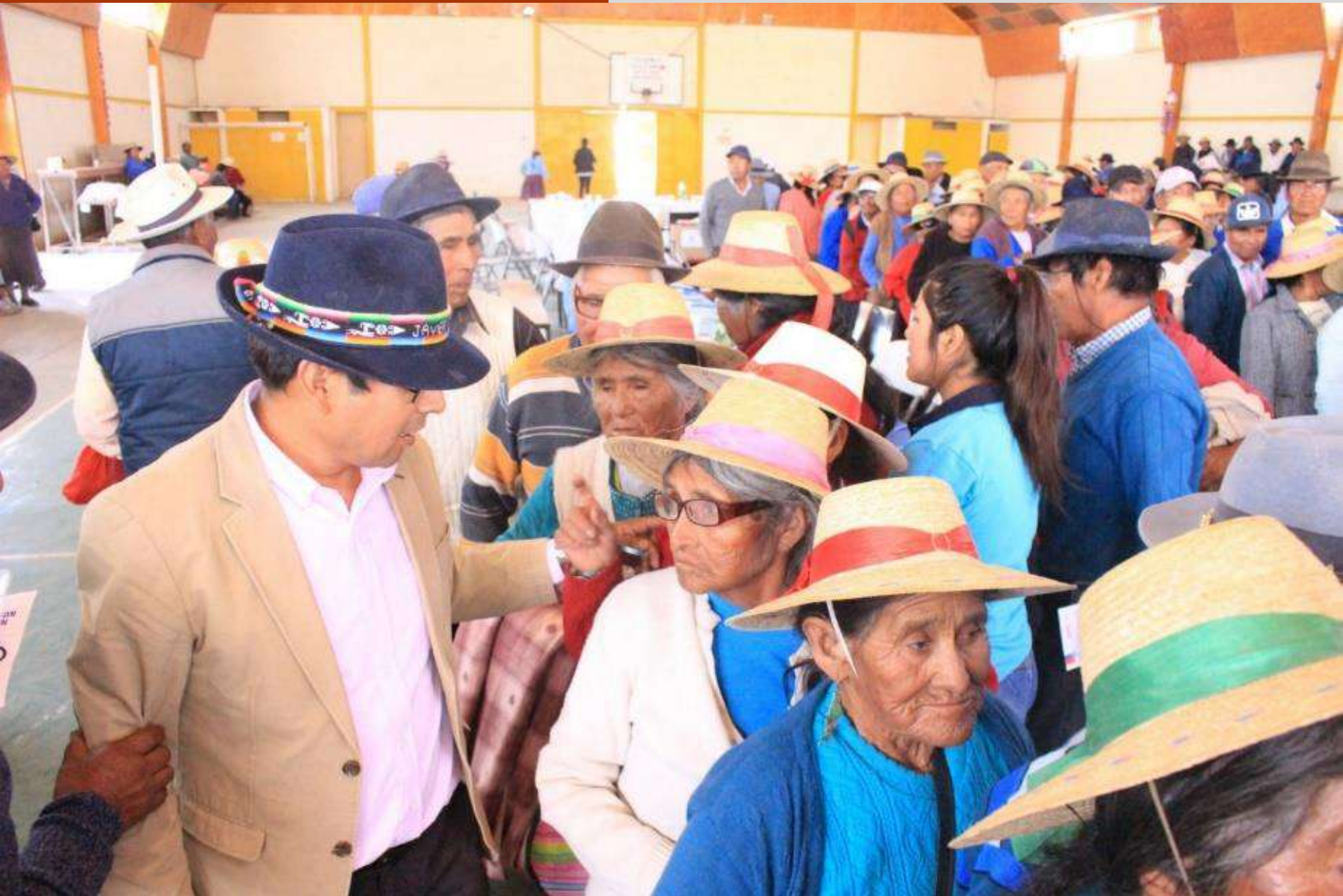
Celebración Bienvenida Primavera 2019.