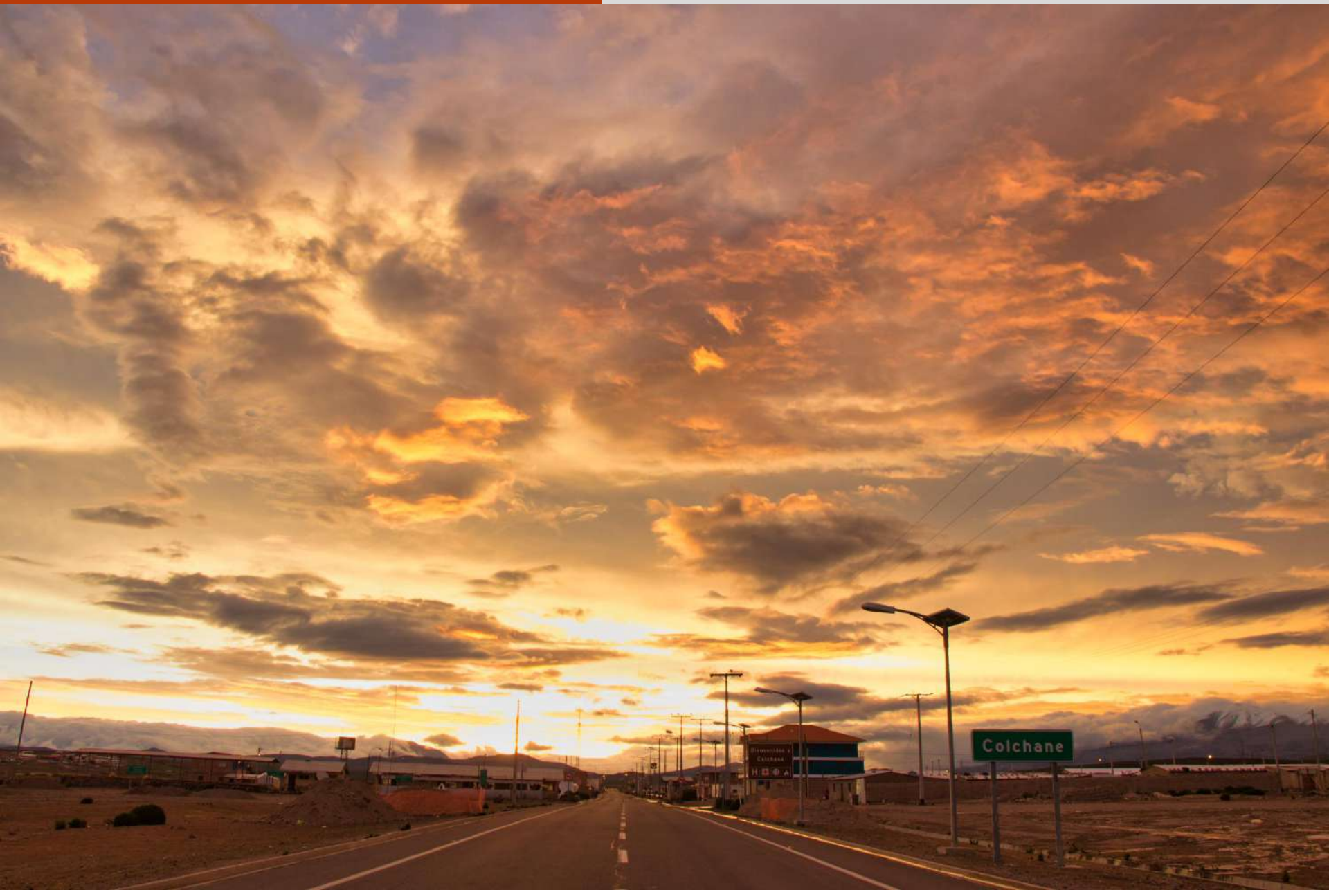
Ruta Internacional 15-CH, Localidad de Colchane.