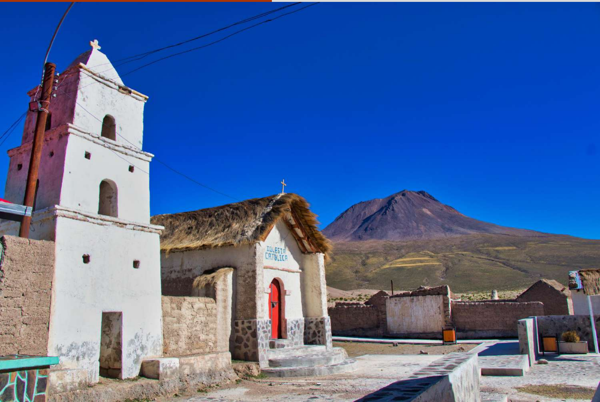
Iglesia Católica de Villablanca, de fondo el Mama Huanapa.