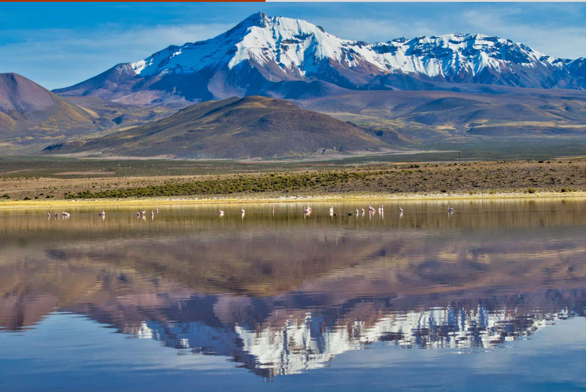
Laguna de Flamencos, Localidad de Escapiña.