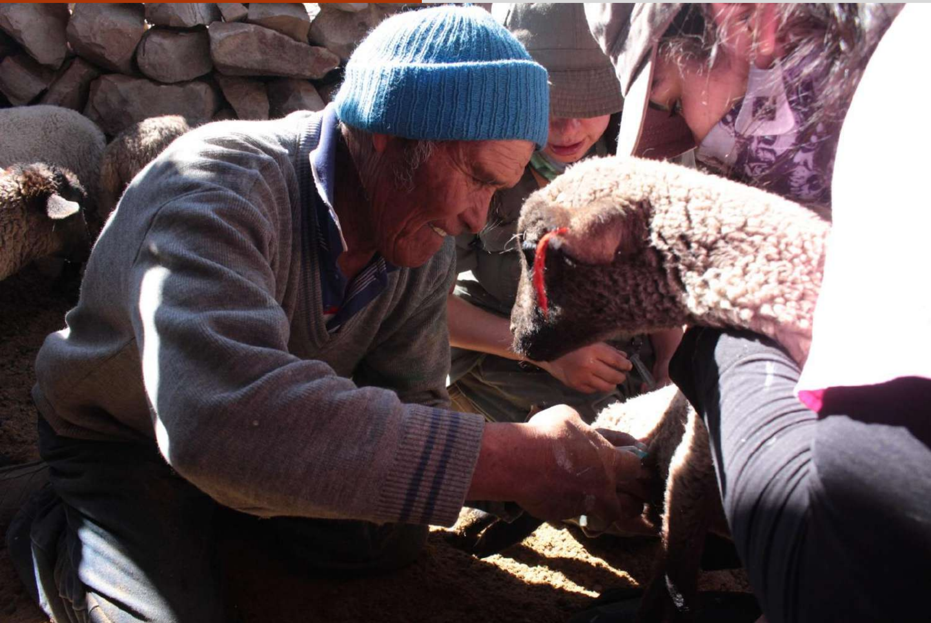
Control Sanitario de Ovinos, sector Cariquima.