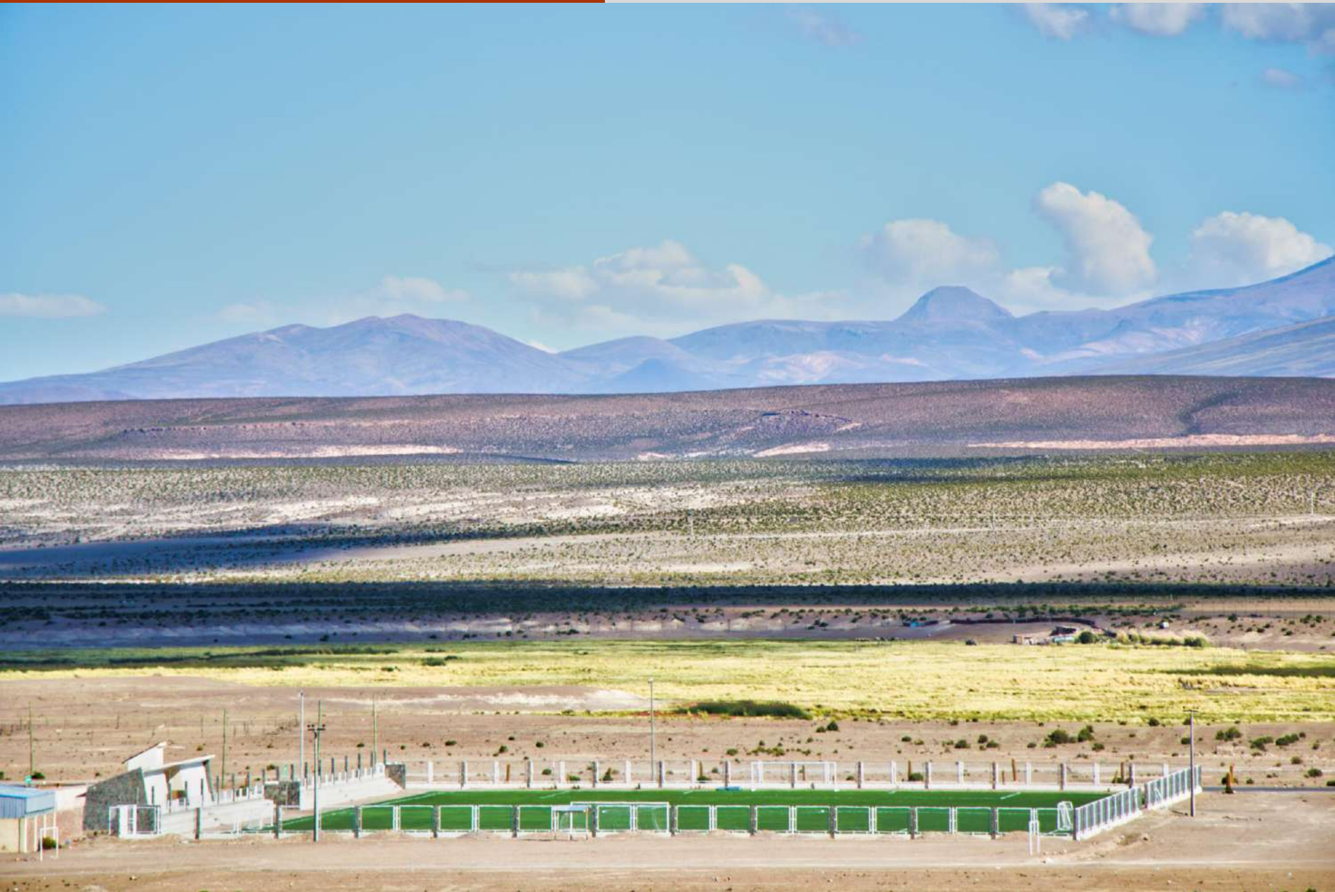
Proyecto Empastado Sintético Estadio Municipal de Colchane.