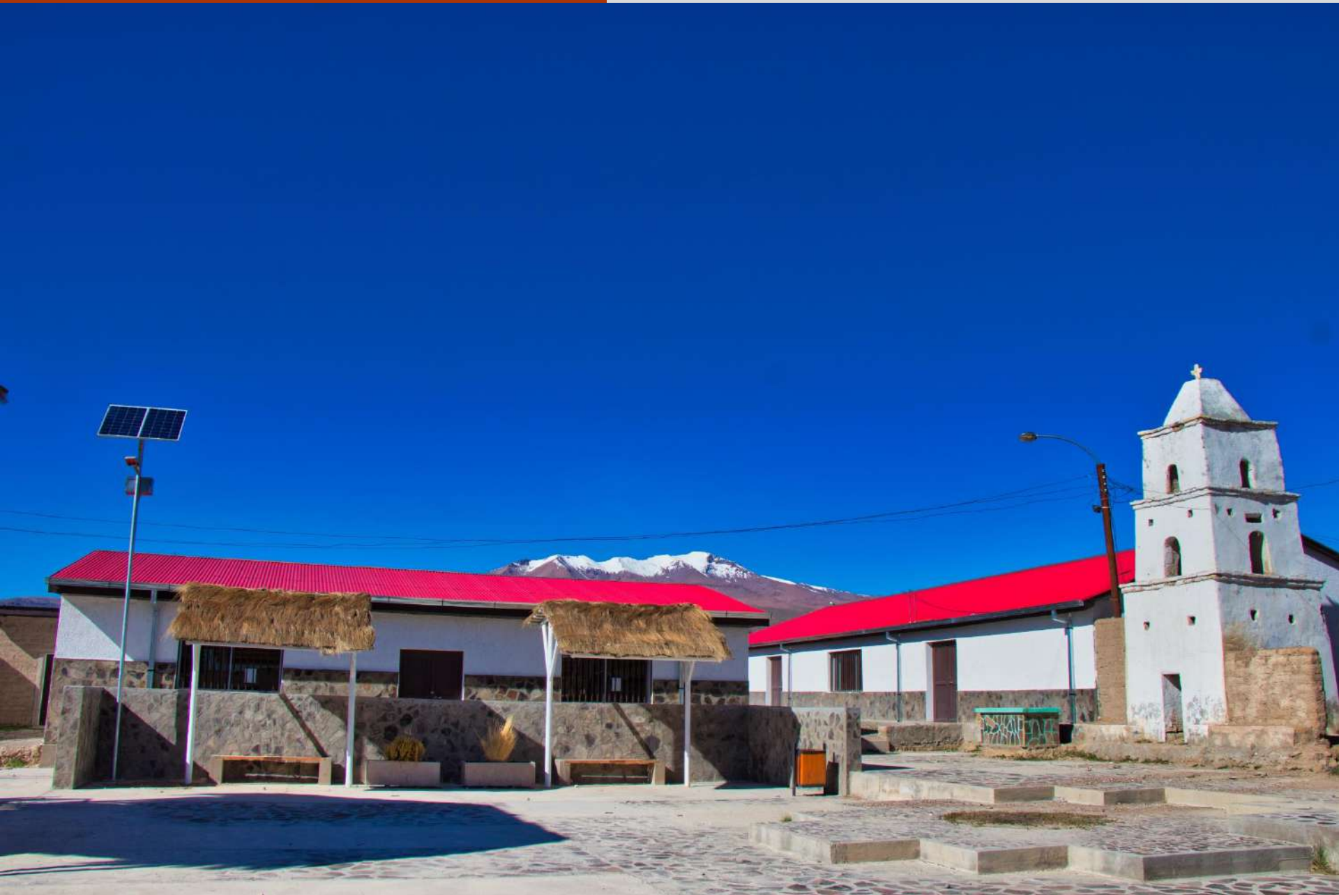
Reparación Sede Social de Villablanca.