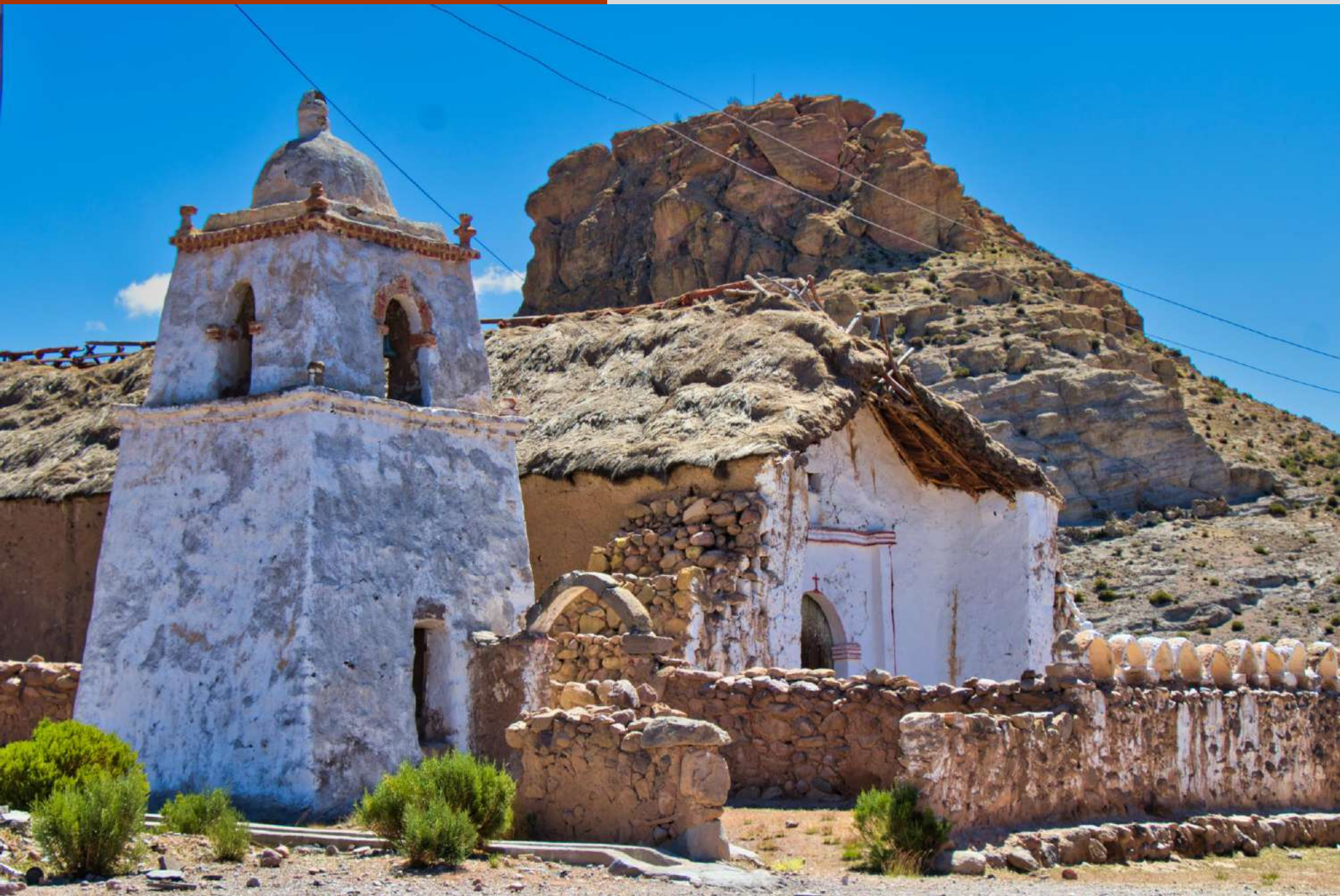
Iglesia de Mauque, Monumento Histórico Nacional.