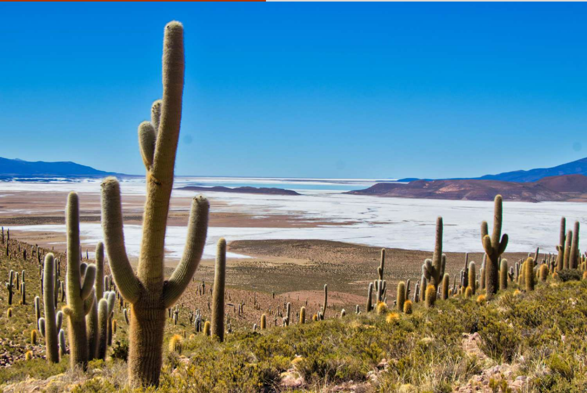
Bosque de Cactus de Thyuma, de fondo el Salar de Coipasa.