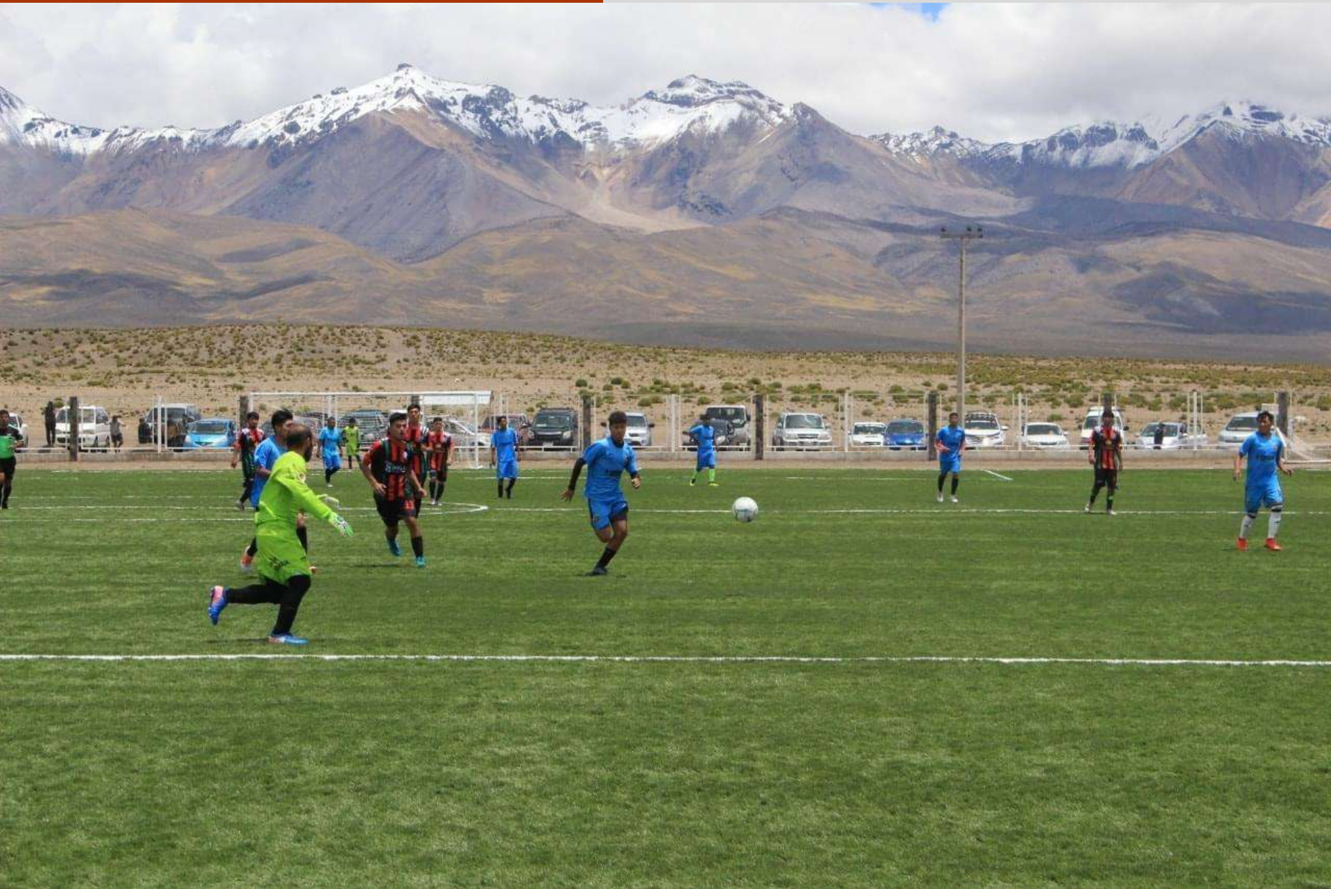
Cancha de Pasto Sintético del Estadio Municipal de Colchane.