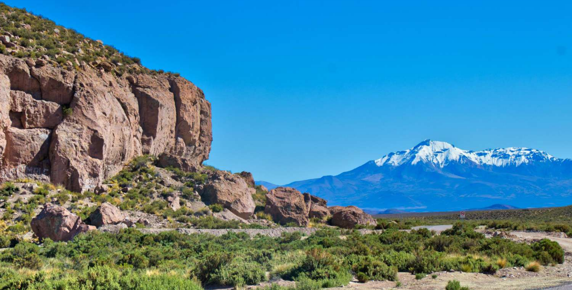
Sector Huaytane, de fondo el Cabaray.