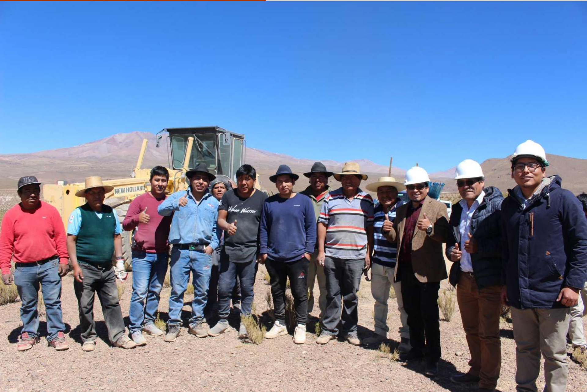
Proyecto comunitario Mejoramiento red de agua de Villablanca.