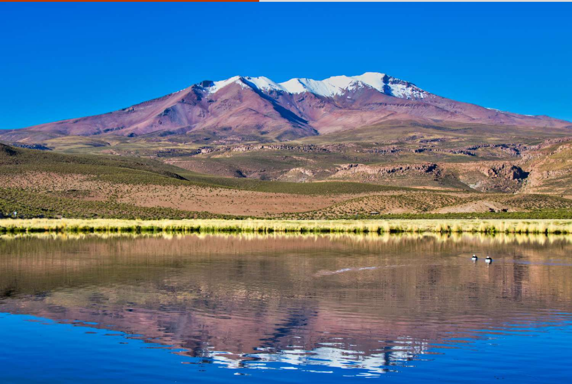
Laguna de Villablanca, de fondo el Sillajhuay.