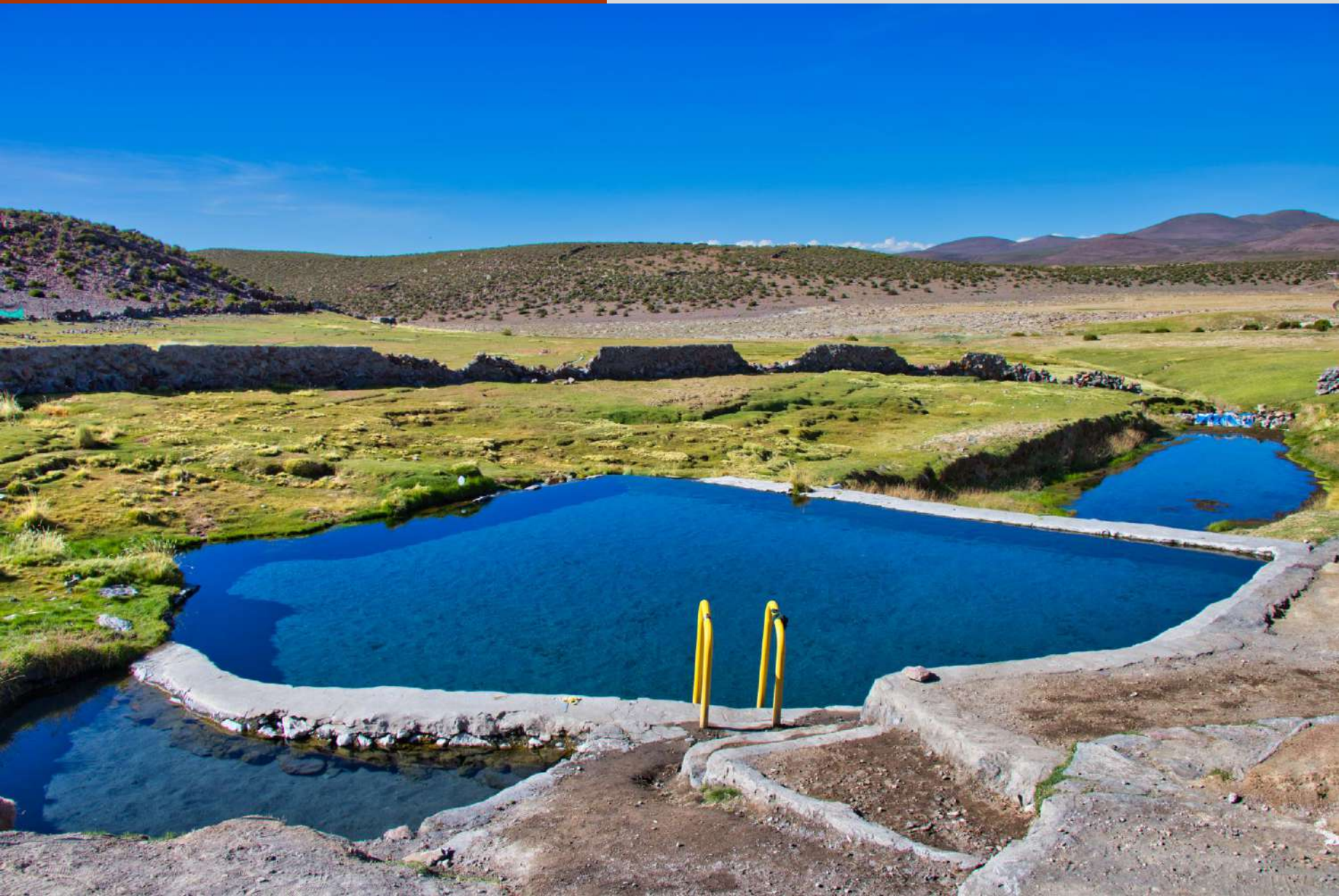
Termas de Enquelga.