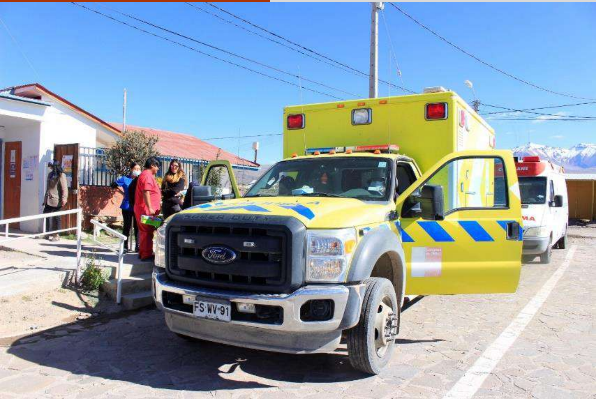
Ambulancias, Posta de Salud Rural de Colchane.