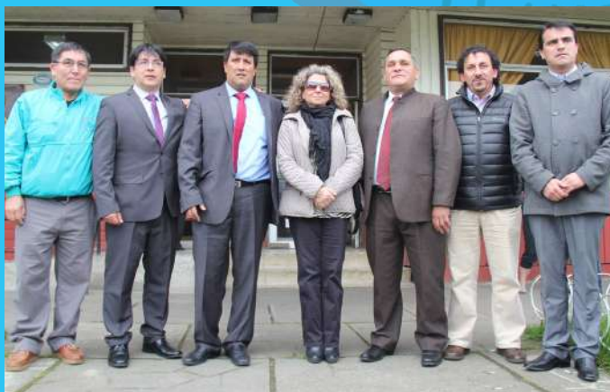
Víctor Angulo Muñoz, Alcalde (S) Ilustre Municipalidad de Llanquihue

A handwritten signature in black ink, appearing to be 'V. Angulo Muñoz', written over a faint blue watermark of the Llanquihue coat of arms.