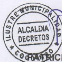
FABRICIO REYES ZAMBRANO ALCALDE DE COQUIMBO (S)