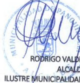
RODRIGO VALDIVIA ORIAS ALCALDE ILUSTRE MUNICIPALIDAD DE PANGUIPULLI