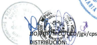
CRISTIÁN MONCKEBERG BRUNER Ministro Secretario General de la Presidencia