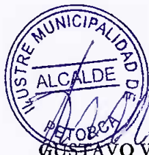
GUSTAVO VALDENEGRO RUBILLO ALCALDE ILUSTRE MUNICIPALIDAD DE PETORCA