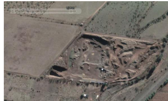
Fotografía N° 11 / Terreno Noráridos S.A. Año 2019