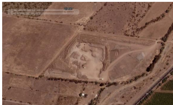
Fotografía N° 10 / Terreno Noráridos S.A. Año 2017