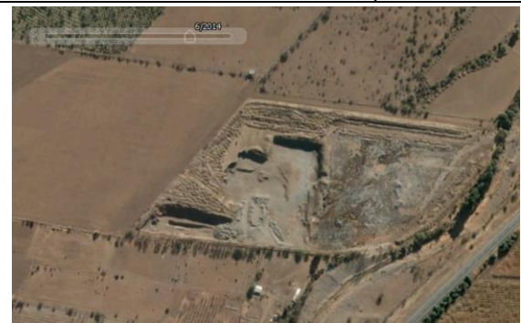
Fotografía N° 9 / Terreno Noráridos S.A. Año 2014