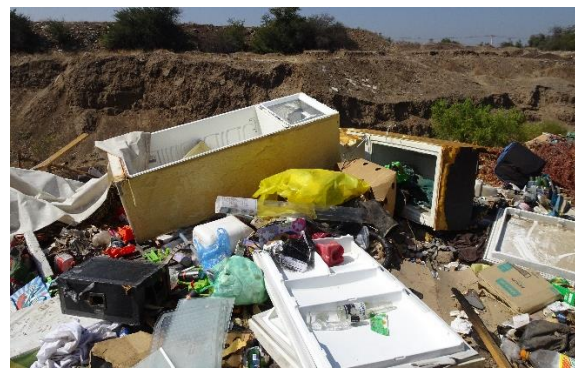
Fotografía N° 16 Microbasural estero Colina entre los puentes San Luis y Colina.