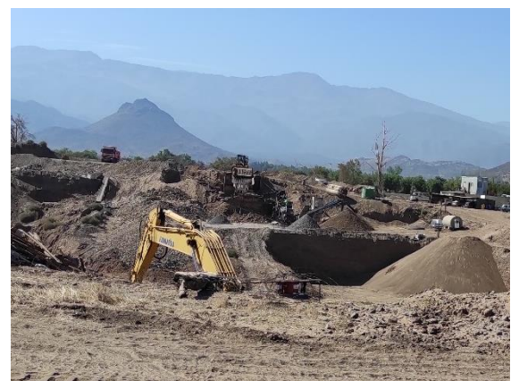
Fotografía N° 5 Excavadora en terreno de Noráridos S.A.