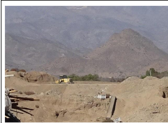
Fotografía N° 2 Cargador frontal retirando material integral desde el talud del pozo lastrero.