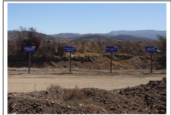
Fotografía N° 7 Carteles de venta de áridos disponibles.