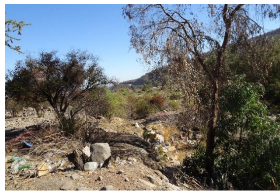
Fotografía N° 19 Microbasural en Estero Colina aguas arriba del Puente Esmeralda ribera sur.