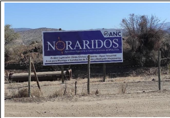
Fotografía N° 6 Afiche empresa Noraridos S.A. en el terreno.