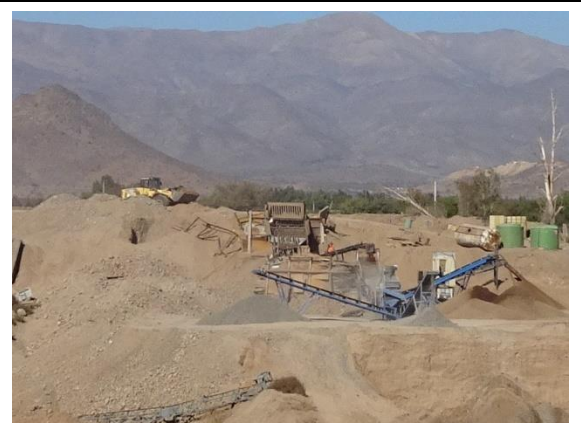
Fotografía N° 3 Cargador frontal llevando material integral hacia la parrilla de la planta de áridos.