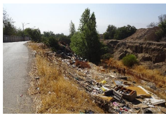
Fotografía N° 14 Microbasural estero Colina entre los puentes San Luis y Colina.