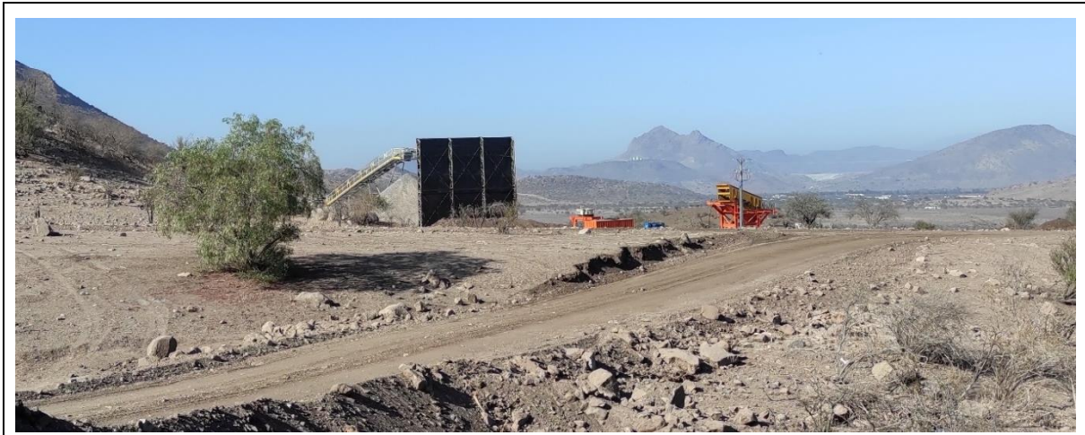
Fotografía N° 1 Actividades de la empresa Canteras Chacabuco S.A.