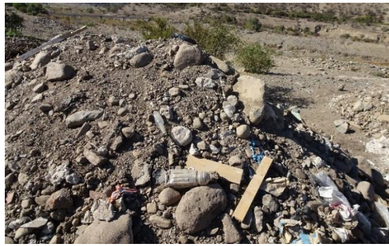
Fotografía N° 20 Microbasural en Estero Colina aguas arriba del Puente Esmeralda ribera norte.