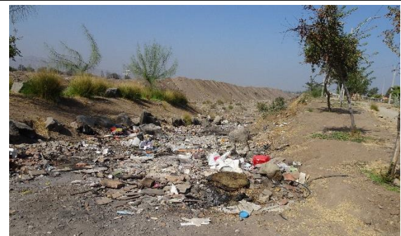
Fotografía N° 13 Microbasural estero Colina entre los puentes San Luis y Colina.