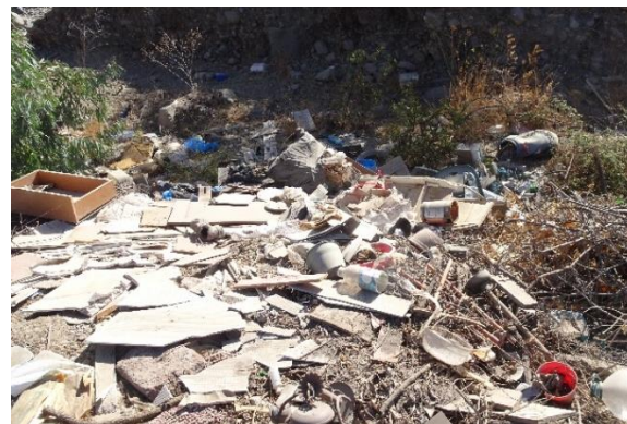
Fotografía N° 18 Microbasural en Estero Colina aguas arriba del Puente Esmeralda ribera norte.