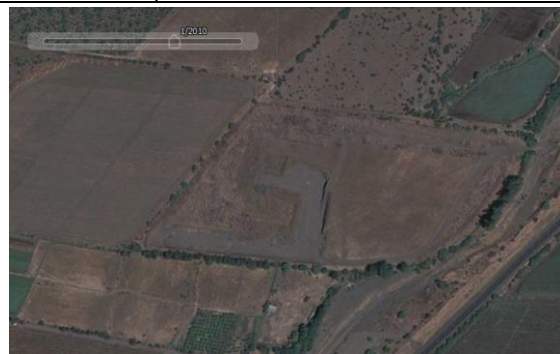
Fotografía N° 8 / Terreno Noráridos S.A. Año 2010