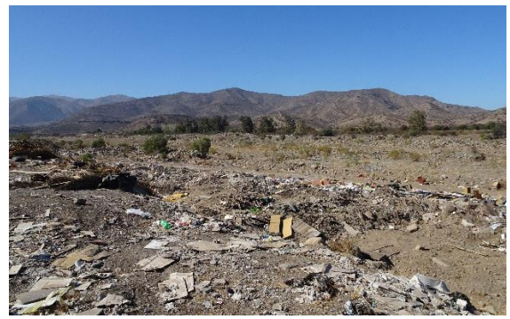
Fotografía N° 21 Microbasural en Estero Colina aguas arriba del Puente Esmeralda ribera norte.