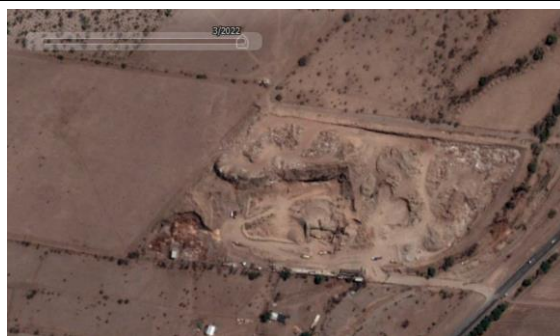
Fotografía N° 12 / Terreno Noráridos S.A. Año 2022