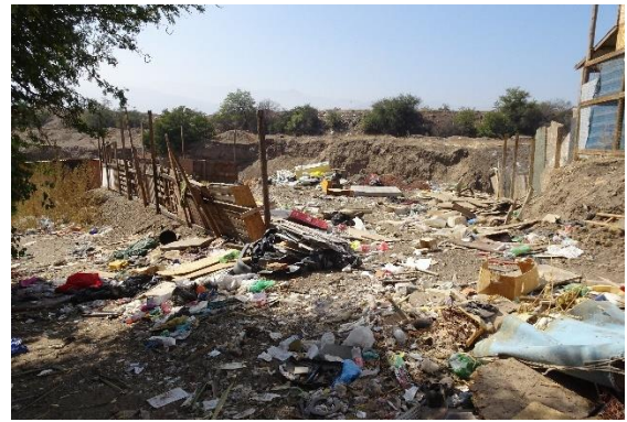
Fotografía N° 15 Microbasural estero Colina entre los puentes San Luis y Colina.