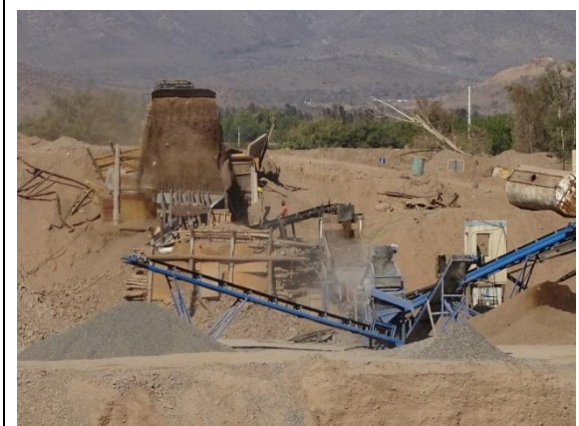
Fotografía N° 4 Cargador frontal descargando material integral en la parrilla de la planta de selección de áridos