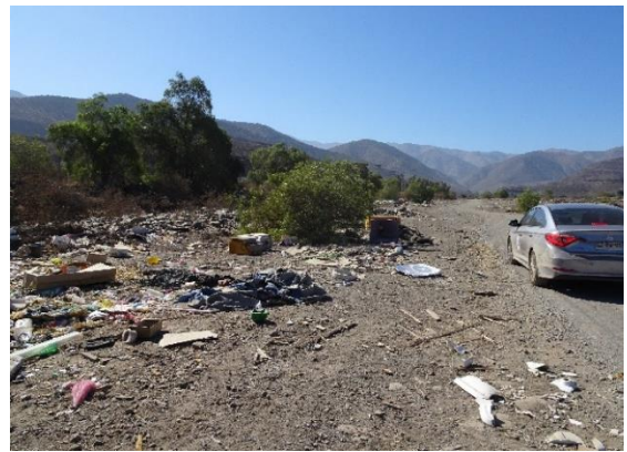
Fotografía N° 22 Microbasural en Estero Colina aguas arriba del Puente Esmeralda ribera norte.