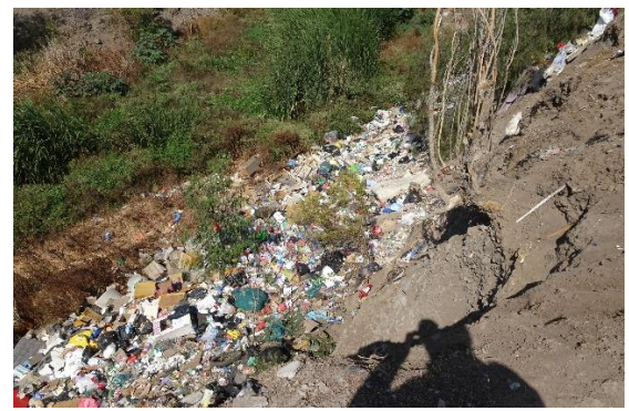
Fotografía N° 17 Microbasural estero Colina entre los puentes San Luis y Colina.