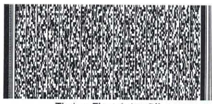
Timbre Electrónico SII

Res.99 de 2014 Verifique documento: www.sii.cl