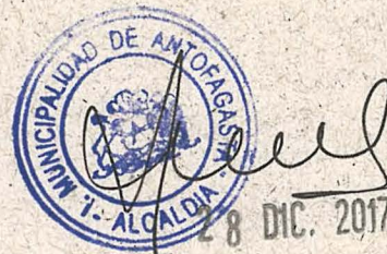
MARCELO CÓRDOVA SEGURA Contralor Regional de Antofagasta Contraloría General de la República