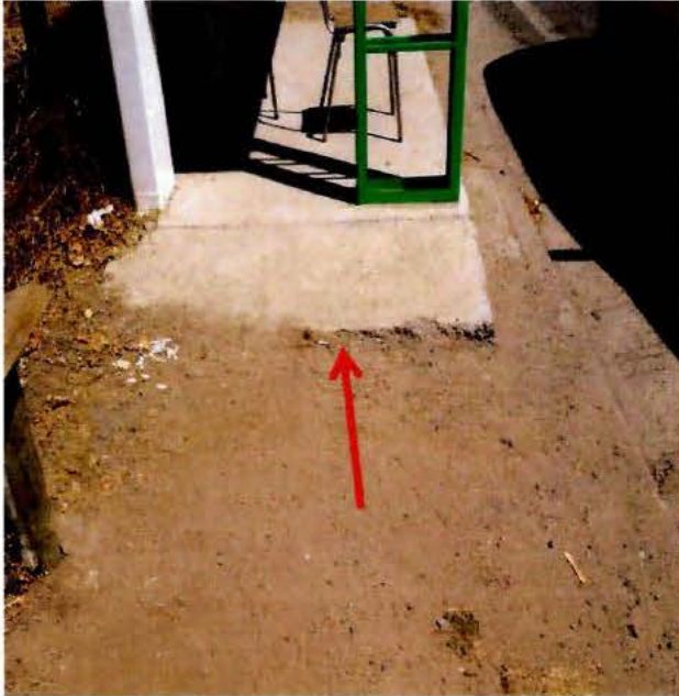
Fotografía Rampa de menor medida a la especificada.