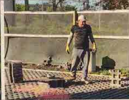
Foto N° 16: 23 de octubre de 2018. Personal trabajando sin sus Elementos de Protección Personal.