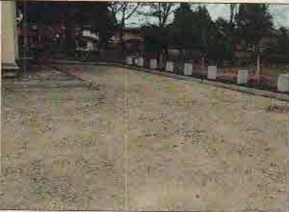
Foto N° 9: 23 de octubre de 2018. Área A, Block 140: Sector de pavimentos con base estabilizada.