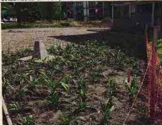
Foto N° 13: 05 de noviembre de 2018. Área C, Block 130: Torre de iluminación sin instalar.