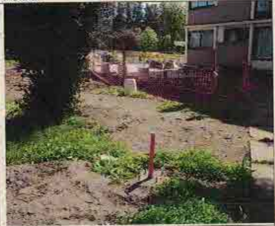
Foto N° 14: 05 de noviembre de 2018. Área A, Block 140: Torre de iluminación sin instalar.