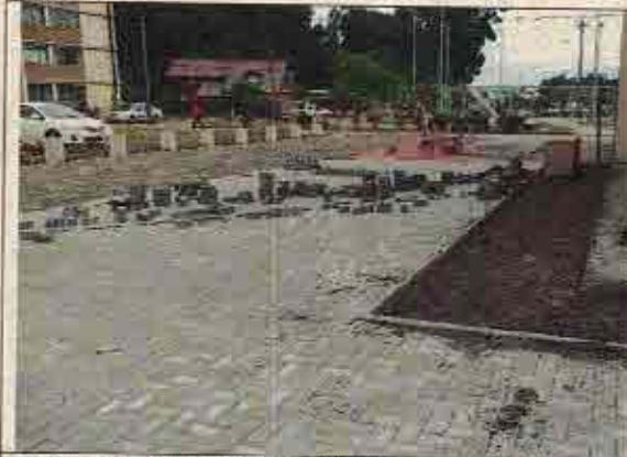
Foto N° 5: 23 de octubre de 2018. Área E, Block 106: Adocreto en proceso de instalación y sin respetar diagramación de colores.