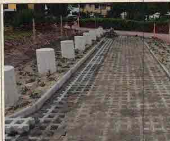
Foto N° 1: 23 de octubre de 2018. Área E, Block 106: Solerilla continua sin espaciamento cada 2 metros.