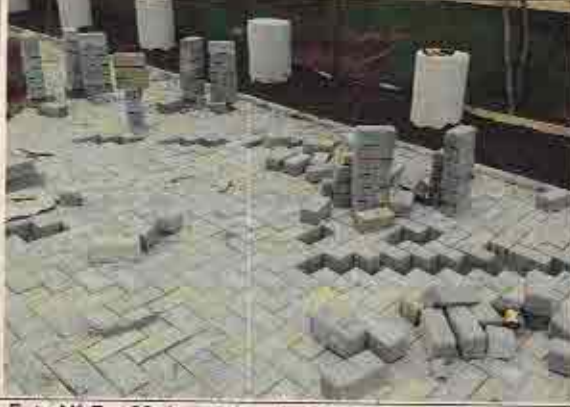
Foto N° 7: 23 de octubre de 2018. Área D, Block 116: Adocreto en proceso de instalación.