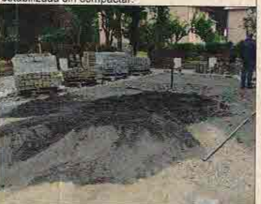
Foto N° 10: 23 de octubre de 2018. Área B, Block 136: Iniciando instalación de adocreto y adocésped.