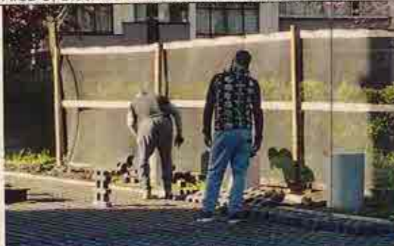
Foto N° 15: 23 de octubre de 2018. Personal trabajando sin sus Elementos de Protección Personal.