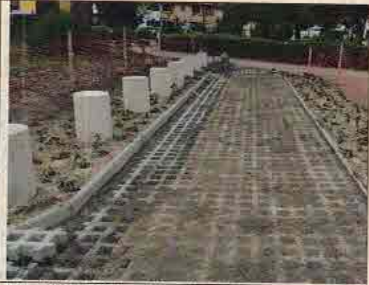
Foto N° 6: 23 de octubre de 2018. Área E, Block 106: Adocésped en proceso de instalación.