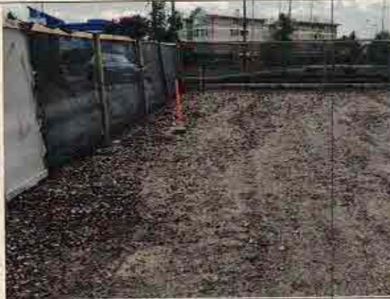
Foto N° 11: 24 de octubre de 2018. Área F, Block 112: Sector de pavimentos con base estabilizada sin compactar.