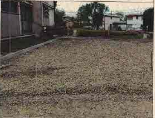
Foto N° 8: 23 de octubre de 2018. Área C, Block 130: Sector de pavimentos con base estabilizada sin compactar.