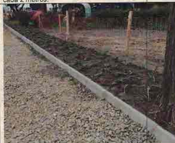
Foto N° 3: 23 de octubre de 2018. Área C, Block 130: Solerilla continua sin espaciamento cada 2 metros.