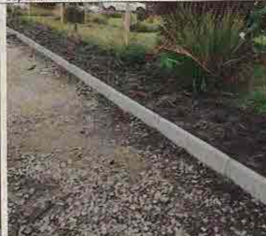
Foto N° 4: 23 de octubre de 2018. Área A, Block 140: Solerilla continua sin espaciamento cada 2 metros.