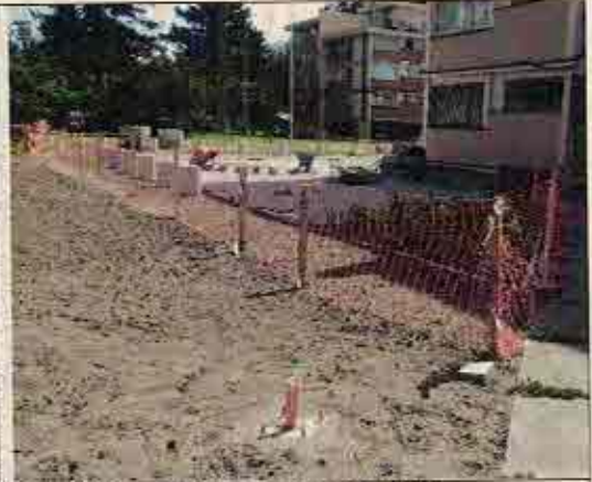
Foto N° 12: 05 de noviembre de 2018. Área E, Block 106: Torre de iluminación sin instalar.