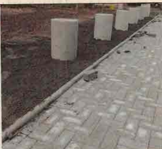
Foto N° 2: 23 de octubre de 2018. Área E, Block 106: Solerilla continua sin espaciamento cada 2 metros.