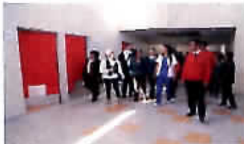
Alcaldesa entrega obras de Cerfem Juan Pablo II