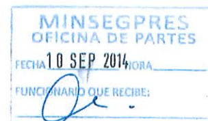
RAMIRO MENDOZA ZÚÑIGA CONTRALOR GENERAL DE LA REPÚBLICA

A LA SEÑORA XIMENA RINCÓN GONZÁLEZ MINISTRA MINISTERIO SECRETARÍA GENERAL DE LA PRESIDENCIA P R E S E N T E