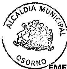
EMETERIO CARRILLO TORRES ALCALDE DE OSORNO