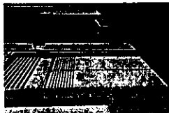
20150911_100123.jpg 4 MB