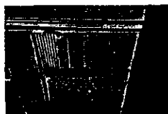
20150911_100144.jpg 3 MB