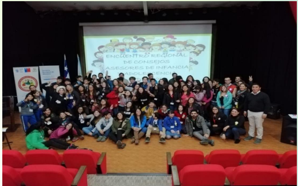
Elección del Consejo Asesor regional 2019