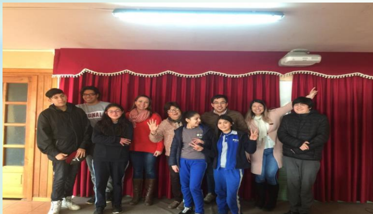
Reunión con autoridades de Lago Ranco.