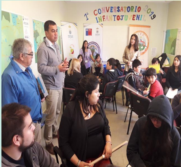
Primer conversatorio infantojuvenil 2019.