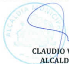
CLAUDIO VILLANUEVA URIBE ALCALDE DE OSORNO (S)