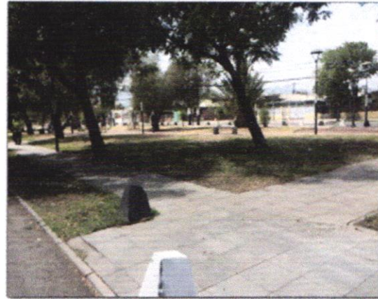
Lugar: Parque Padre Esteban Gumucio