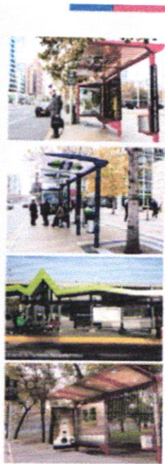
Directorio de Transporte Público Metropolitano | 2