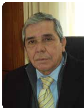
Edwin Von Jentschyk Alcalde de Negrete

Con el profundo deseo de que esta gestión municipal este dando cuenta de las necesidades de nuestra comunidad y haya sido un efectivo aporte al desarrollo social, económico y familiar de los miembros de nuestra querida comuna, pongo a disposición de ustedes la Cuenta pública 2011.-