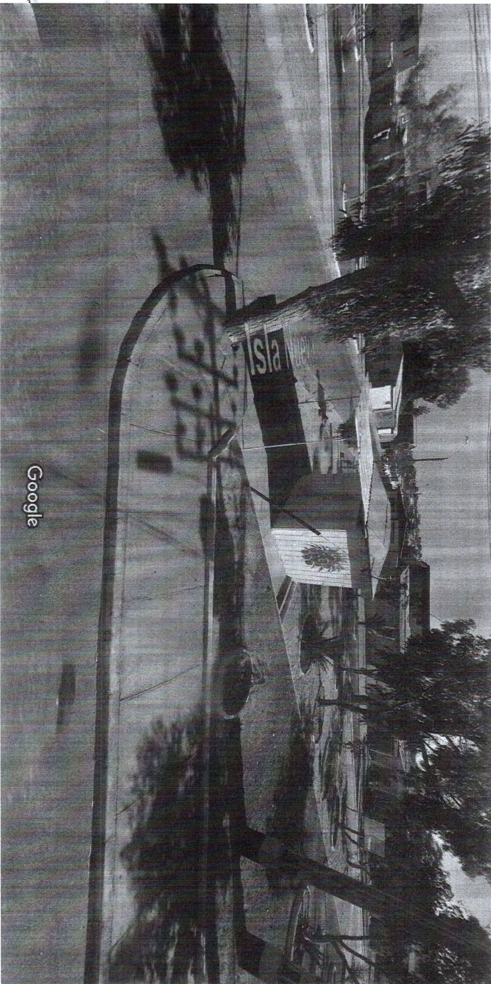
Captura de imágenes: dic. 2012